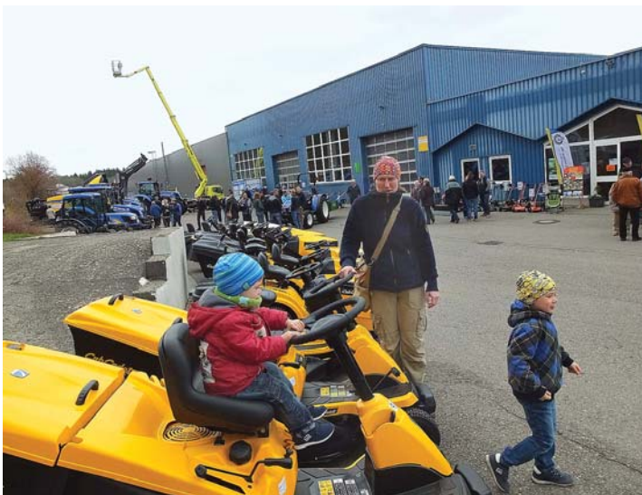
Die Ausstellung bei Brachat & Schönle lässt auch Kinderherzen höher schlagen.