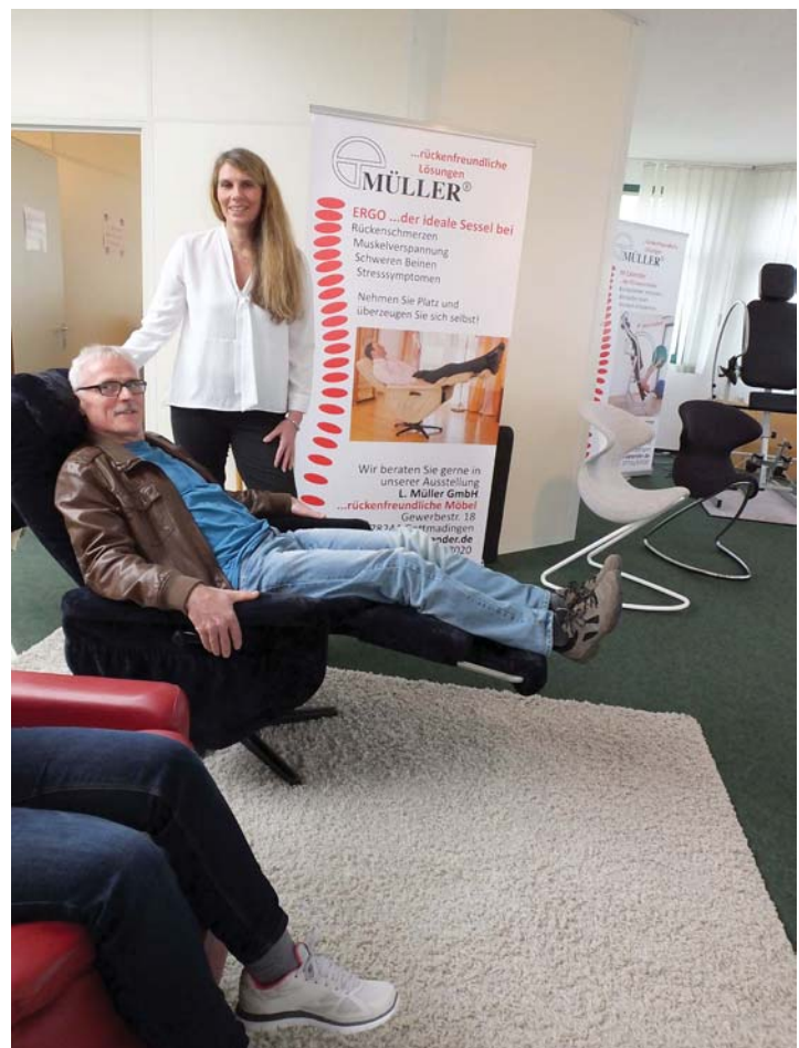
Beim Rundgang laden die Massagesessel bei der Firma L. Müller zum Entspannen ein.

Gewerbestr. 22 Gottmadingen www.osann-fabrikverkauf.de