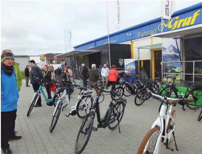
Bei dieser Auswahl bei Fahrrad Graf kann die Fahrradsaison optimal starten.