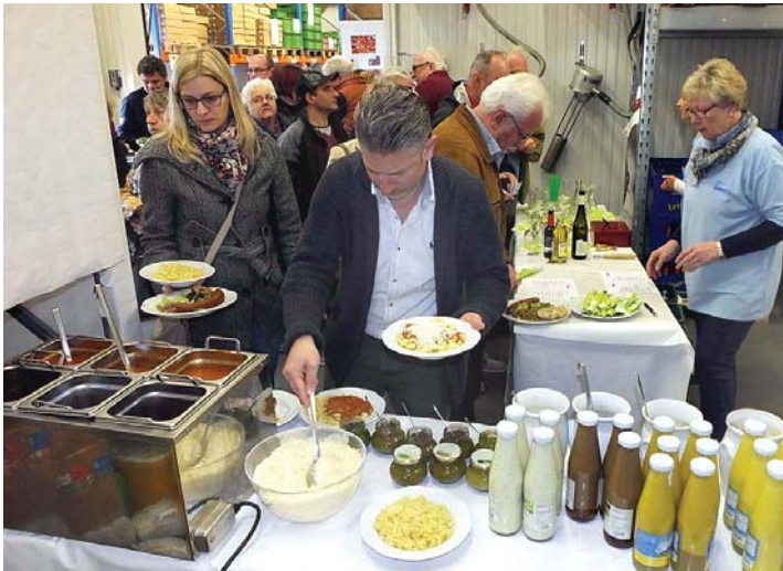
Kulinarisch können sich die Besucher unter anderem bei Delikat essen Bruderhofer verwöhnen lassen.