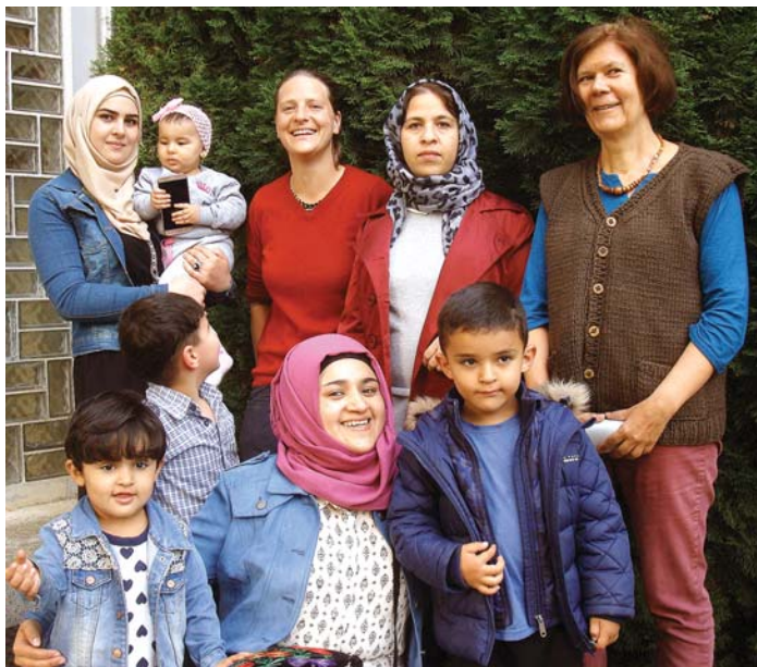
Alle Frauen, ob einheimisch, zugezogen oder zugewandert, sind morgen, Donnerstag, 26. Oktober, von 10 bis 12 Uhr ins Katholische Gemeindezentrum zu einem internationalen Frauen-Frühstück eingeladen.