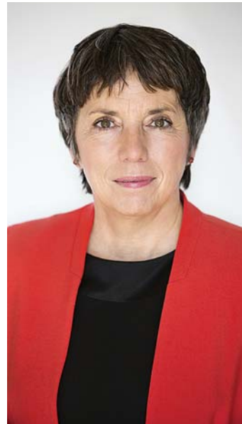
Am 13. Dezember zu Gast in Engen: die Theologin Margot Käßmann.