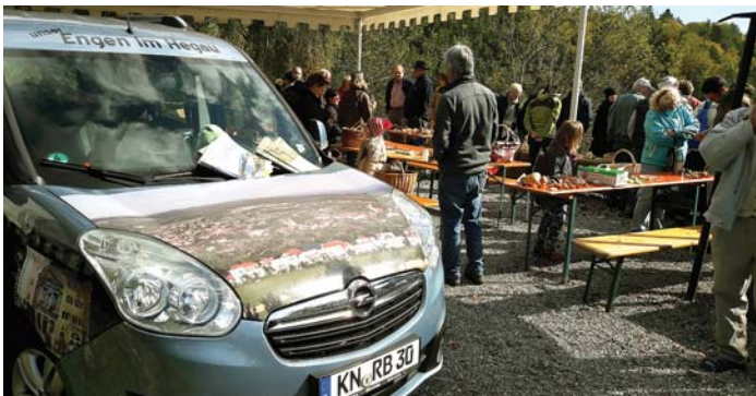
Ein Blickfang ist das Werbefahrzeug des Vorsitzenden des Touristik-Vereins Engen.

Auch an der Zimmerholzer Hütte stand das Werbefahrzeug mit Prospekten und die Gäste wurden vom Vorsitzenden begrüßt, der das breite Angebot an Stadtführungen, Ferienwohnungen, E-Bike-Verleih und vieles mehr vorstellte. Die Besucher zeigten sich verwundert, dass in Engen in Sachen Tourismus von der Stadt Engen und dem Touristik-Verein so viel geleistet wird. Natürlich wurde auch auf die Web-Cam hingewiesen, die live Engen und Umgebung zeigt. Es werden dieses Jahr noch weitere Feste und Veranstaltungen an der Hütte gemacht, Termine können noch im Internet www.touristik-engen.de erfragt werden.