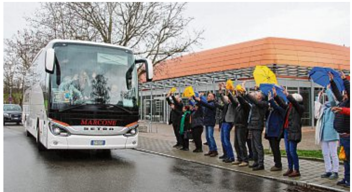
Mit einer »La Ola«-Welle wurden die Freunde auf die lange Fahrt zurück nach Moneglia geschickt. Der nächste Gegenbesuch lässt nicht lange auf sich warten: Bereits Ende April fahren Schüler der Klassen sieben und acht des Anne-Frank-Schulverbundes in die Partnerstadt an der »Riviera di Levant«.