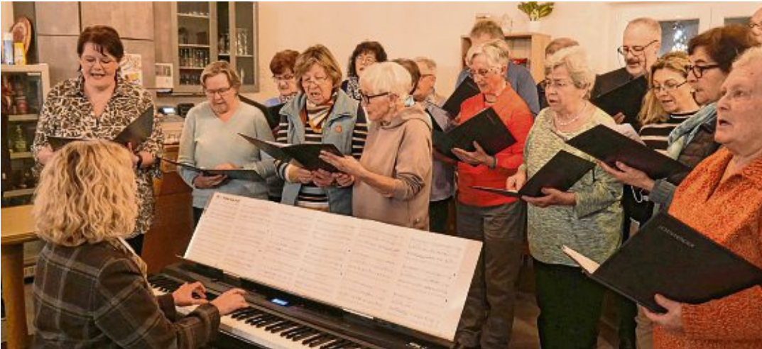
Mit Liedern eröffnete und beendete der Hohenhewenchor die Jahresversammlung.

Der Hohenhewenchor wird 140 Jahre - gefeiert wird mit einer Matinée am 23. Juni