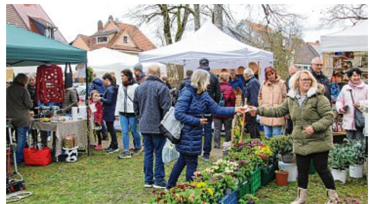
Im Alten Stadtgarten fanden zehn Stände Platz. Im Angebot hatten sie unter anderem: Pflanzen und Floristik, Holzarbeiten, Kerzen und Nährarbeiten, Schmuck, Korbwaren, Deko aus Beton und Nützliches für den Haushalt.