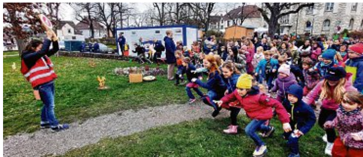
Ostereier-Rallye: Mit Feuereifer suchten die Kids im kleinen Park am Kriegerdenkmal nach Ostereiern, die sie dann in Schokohasen-Lollis umtauschen konnten.