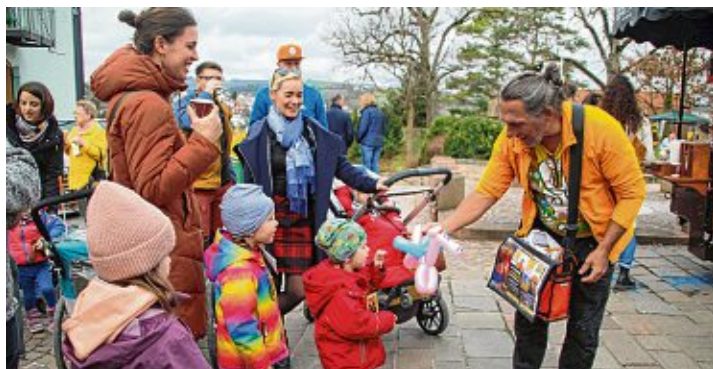
Ein Einhorn, ein Einhorn! Mit flinken Fingern wurden Ballons modelliert, dabei blieben keine Wünsche offen und die bunten Gebilde sorgten für leuchtende Kinderaugen.