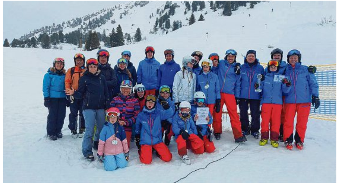
Der Skiclub Engen trug die Stadt- und Vereinsmeisterschaften aus.