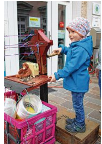
Den Dreh raus hatte diese junge Dame, die sich von der Seilerin in die Kunst des Seiledrehens einweisen ließ.