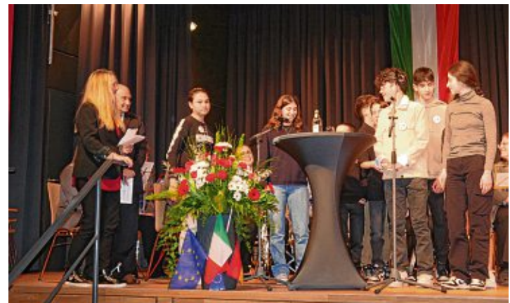
Grüße aus der italienischen Partnerstadt überbrachte auch die Jugend Moneglias, die zahlreich erschienen war.