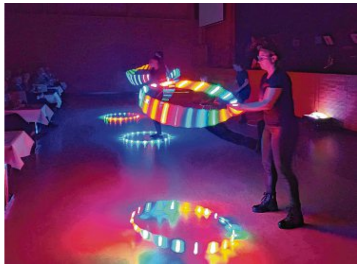
Mit leuchtenden Reifen und Jonglierkeulen verzauberten die Licht- und Akrobatikünstler des »Circus Casanietto« Gäste und Einheimische gleichermaßen