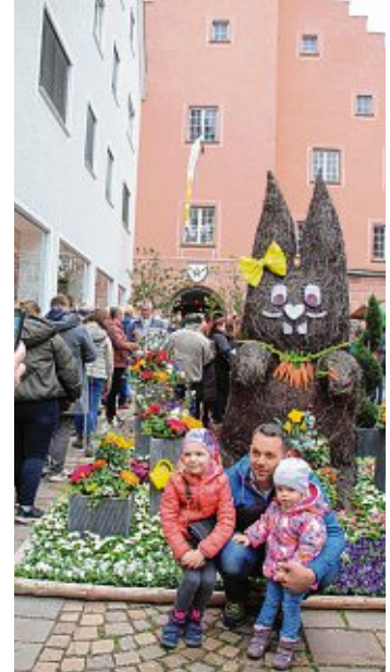
Ein beliebtes Fotomotiv war der blumengeschmückte Hase vor dem Rathaus. »Das kommt in den Kalender für Opa«, verriet diese kleine Familie.

spannt eine Jeans und eine auch noch eine neue Jacke geholt«, freute sich ein junger Mann aus Watterdingen über zwei modische Schnäppchen. Auch das Wetter spielte diesmal weitgehend mit - bis auf einen rund anderthalbstündigen, leichten Regen am Nachmittag konnten HändlerInnen und MarktbesucherInnen den Regenschirm zu lassen.