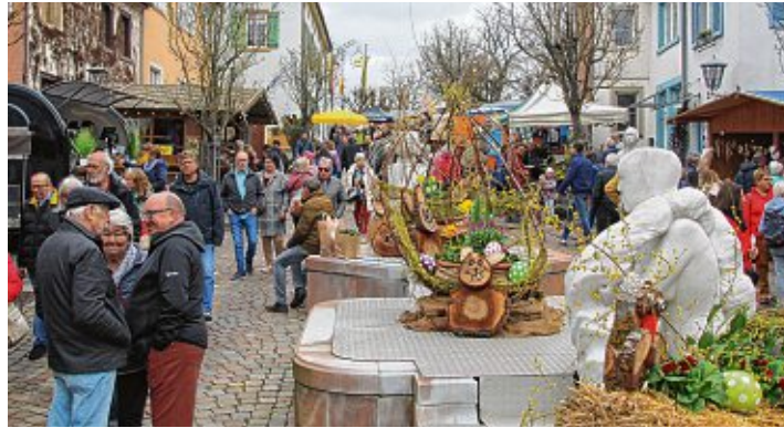
Ganz Engen war auf den Beinen und auch viele Gäste aus dem Hegau, dem Stuttgarter Raum und der Schweiz schlenderten am vergangenen Sonntag durch die österlich geschmückte Stadt.

Engen (cok). Einen wahren Ansturm erlebte die Engener Altstadt am vergangenen Sonntag: Schon vor dem offiziellen Beginn des Ostermarktes um 11 Uhr füllten sich Gassen, Plätze und der Alte Stadtgarten. Um die Mittagszeit gab es stellenweise kaum noch ein Durchkommen und bereits um 14 Uhr meldeten einige Essensstände: »Wir sind ausverkauft«. Hungern und dursten musste trotzdem niemand, denn das kulinarische Angebot war sehr umfangreich - ebenso wie das Angebot an Kunsthandwerk: »Ich hatte schon gehört, dass der Ostermarkt schön sein soll - aber das hier ist tatsächlich noch besser, als erwartet«, begeisterte sich etwa eine Besucherin aus Eigeltingen, die »mit Kind und Kegel« in diesem Jahr zum ersten mal dabei war. Ihre Zwillinge hatten Spaß beim Kinderprogramm und sie selbst habe bei der Osterdeko