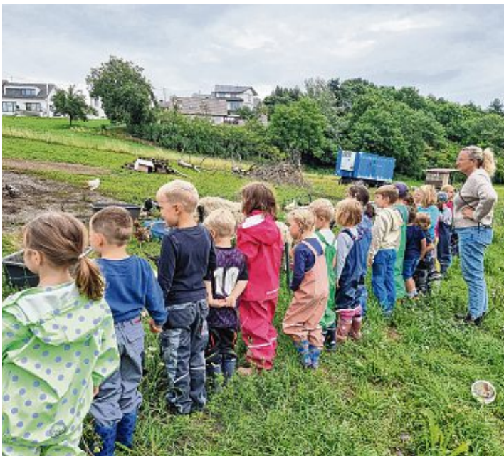
Viele Tiere, darunter Ziegen, Schafe, Hühner und Enten, durften beobachtet und gestreichelt werden.