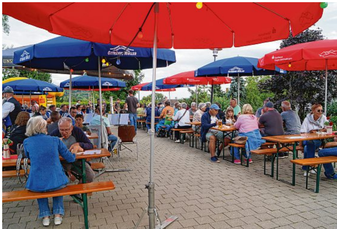
Hier ließ es sich gut verweilen: Beim Feierabendhock des Feuerwehr-Fördervereins Anselfingen.

Die größeren Besucher machten es sich am großen Ausschankwagen, an den Stehtischen und auf den Festzeltgarnituren gemütlich und machten regen Gebrauch vom reichhaltigem Angebot an Speisen und Getränken. Sonnenschirme