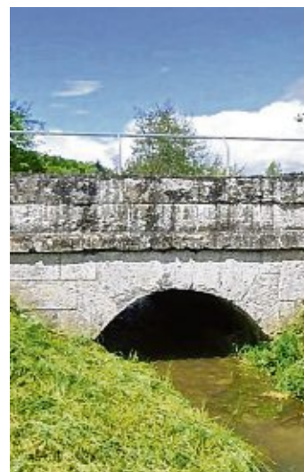
Die Mühlbachbrücke an der L 190 in Welschingen wird vorübergehend gesperrt.

Die bei den Untersuchungen gewonnenen Erkenntnisse dienen sowohl der späteren Entsorgung des alten, als auch der Detailplanung des neuen Brückenbauwerks. Der Zeitplan für den Bau des Radwegs ist noch nicht absehbar.