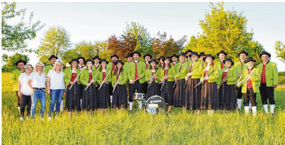
Am 29. und 30. August lädt der Musikverein Zimmerholz zum Epfelkuächäfescht.

MV Zimmerholz lädt von Freitag bis Samstag zum großen Epfelkuächäfescht