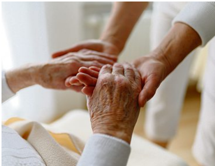
Entlastung im Alltag bieten ehrenamtliche Pflegelotsen.

Hegau. Der Landkreis Konstanz sucht ehrenamtliche Pflegelotsen. Diese entlasten pflegebedürftige Menschen und deren Angehörige im Alltag. Sie unternehmen je nach vorheriger Vereinbarung gemeinsam Spaziergänge, helfen beim Schriftverkehr oder leisten Gesellschaft. Die Ehrenamtlichen erhalten wiederum Unterstützung durch Fortbildungen und regelmäßige Austauschtreffen