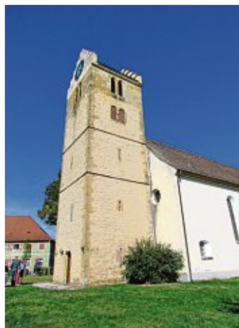
Auch die Alte Kirche Welschingen kann am Denkmaltag am 14. September besichtigt werden.

»Wertvoll: unbezahlbar oder unersetzlich?«