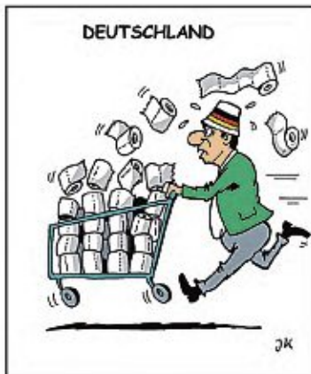
»Es lebe der Unterschied«, 2020 Jens Kricka.