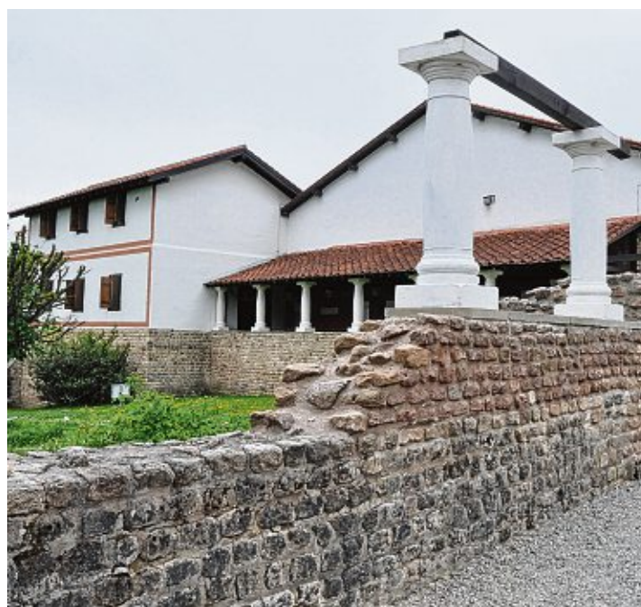
Das römische Freilichtmuseum in Hechingen-Stein.

Im Museum gibt es ein gemütliches kleines Imbiss- und Kioskgeschäft, das zu einer kleinen Pause einlädt.