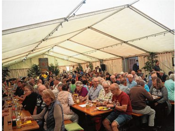
Mit Pommes, Zanderknusperle, Salatteller oder »Barga Burger« wurden die Besucher an den drei Festtagen verwöhnt.

Das traditionelle Bargaer Dorffest am ersten Augustwochenende war trotz gelegentlicher Schauer gut besucht: Im Festzelt saßen die Besucher trocken und konnten bei zünftiger Blasmusik und leckeren Spezialitäten ins Gespräch kommen.