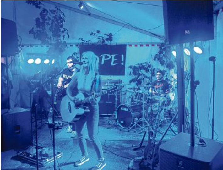
Den Auftakt machte der traditionelle Partyabend am Freitag mit der Band »NOPE«, die für ausgelassene Stimmung im Zelt sorgte.

Der Musikverein Barga feierte mit vielen BesucherInnen