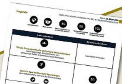
Alle Regeln im Überblick auf Baden-Württemberg.de :

In Clubs und Diskotheken gilt weiterhin 2G plus Test , in Dampfbädern etc. 2G .