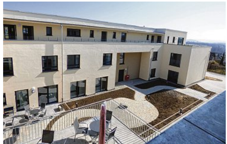
Das Evangelische Pflegeheim »Aachquelle« präsentiert sich offen, hell und modern.