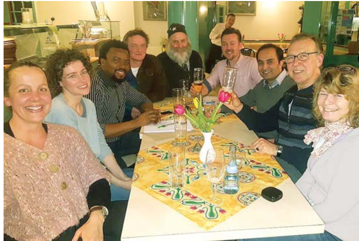
Das Vorbereitungsteam des Englischen Abends traf sich am 6. März im Restaurant Capri.

Die Stadtwerke Engen sind bemüht, diese Anrufe zu unterbinden, und hoffen auf die Mithilfe der Bürger. Bitte entsprechende Anrufe bei den Stadtwerken melden.