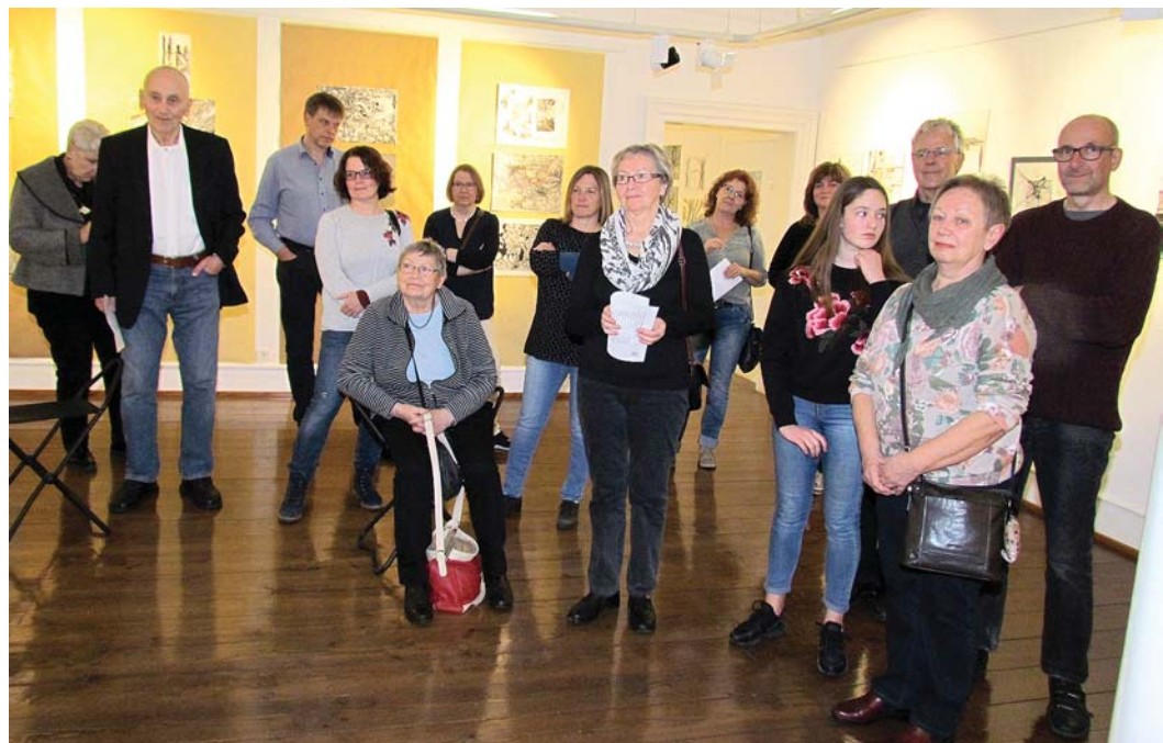
Nicht nur die Teilnehmerinnen und Teilnehmer der Museumspädagogischen Workshops 2017 versammelten sich am vergangenen Donnerstagabend zur Vernissage der Ausstellung »Werkschau Museumspädagogik« im »forum regional« des Städtischen Museums Engen, sondern auch Familienmitglieder, Freunde, Bekannte und weitere Interessierte.