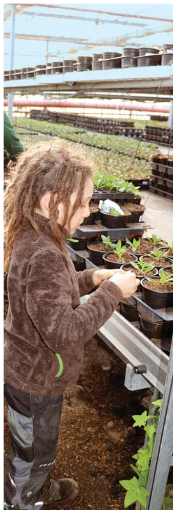
Ein »Minigärtner« bei der Arbeit.