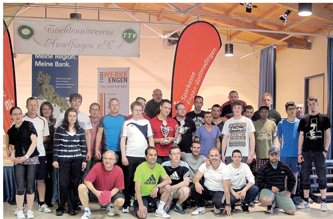
Alle Teilnehmer des Tischtennis-Grümpeltturniers des TTV Anselfingen auf einen Blick.

Besonderer Dank galt auch in diesem Jahr wieder den zahlreichen Sponsoren des Tischtennis-Grümpeltturniers, die neben finanzieller Unterstützung auch unzählige nützliche Sachpreise stifteten, um die wie gewohnt üppigen Preiskörbe zu ermöglichen.