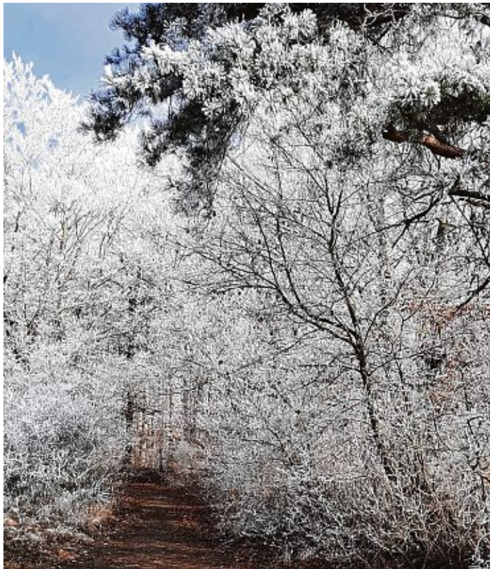
Die Natur ist ein Künstler , wie dieses Foto von Familie Kaiser aus Neuhausen beweist. Der Raureif überzog in der vergangenen Woche jedes noch so kleine Ästchen und verlieh den Bäumen und Büschen einen ganz besonderen Zauber.