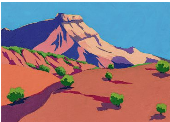
Wolfram Scheffel, Marokko II 2020, Öl auf Leinwand. Bild: Künstler

Ausstellung von Wolfram Scheffel läuft bis 27. März