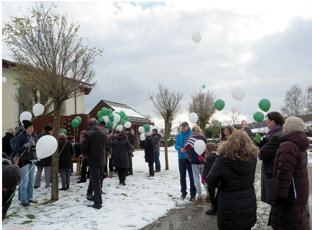
Ein Zeichen der Hoffnung und guten Wünsche: Die Mitglieder des Jugendgemeinderats verteilten grüne und weiße Ballons an die Besucher der Gedenkfeier zum Volkstrauertag auf dem Friedhof.