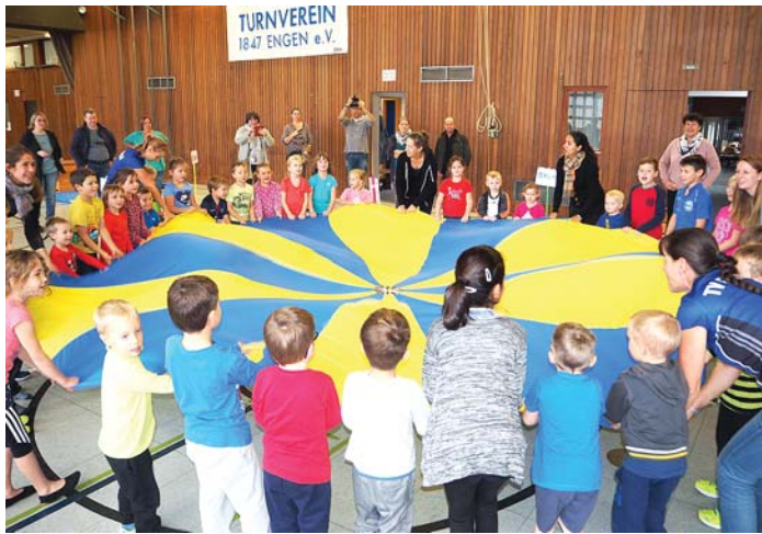
»Das Karussell dreht sich ganz schnell« - immer zur vollen Stunde ließen Kinder und die Helfer vom TV Engen und TG Welschingen beim gemeinsam veranstalteten »Tag des Kinderturnens« das große Schwungtuch kreisen. Mal durften die Jungs, mal die Mädchen unter das Tuch kriechen. Der Tag des Kinderturnens steht unter dem Motto »Bewegung für alle« und richtet sich auch an Kinder mit Handicap.