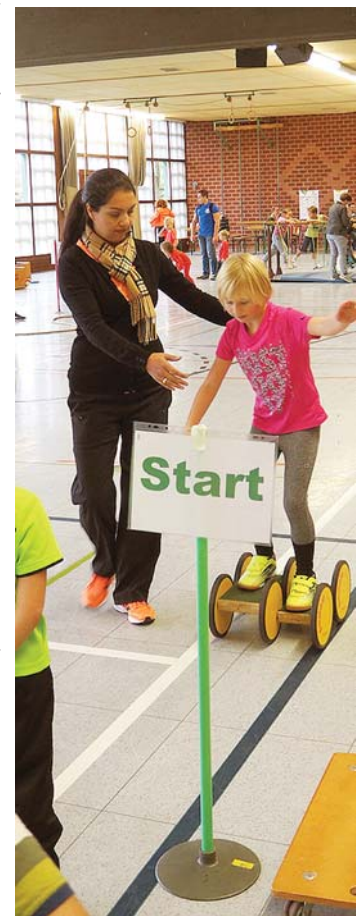
Bei der Rundfahrt mit dem Pedalo waren Koordinationsgeschick und helfende Hände gefragt. Für jüngere Kinder standen Rollbretter bereit.

einer Langbank und Geschicklichkeitstests wie Werfen und Auffangen wurde auch der Fühl- und Tastsinn trainiert, wenn etwa in einem »Krabbelsack« Gegenstände erfüllt werden mussten. Insgesamt 60 Kinder fanden sich zum Tag des Kinderturnens ein und durften anschließend eine Urkunde, eine (leckere) Medaille und weitere kleine Präsente mit nach Hause nehmen.