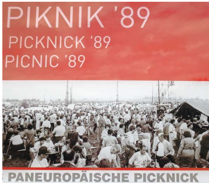
Foto vom Paneuropäischen Picknick im August 1989 bei Sopron/Ungarn.