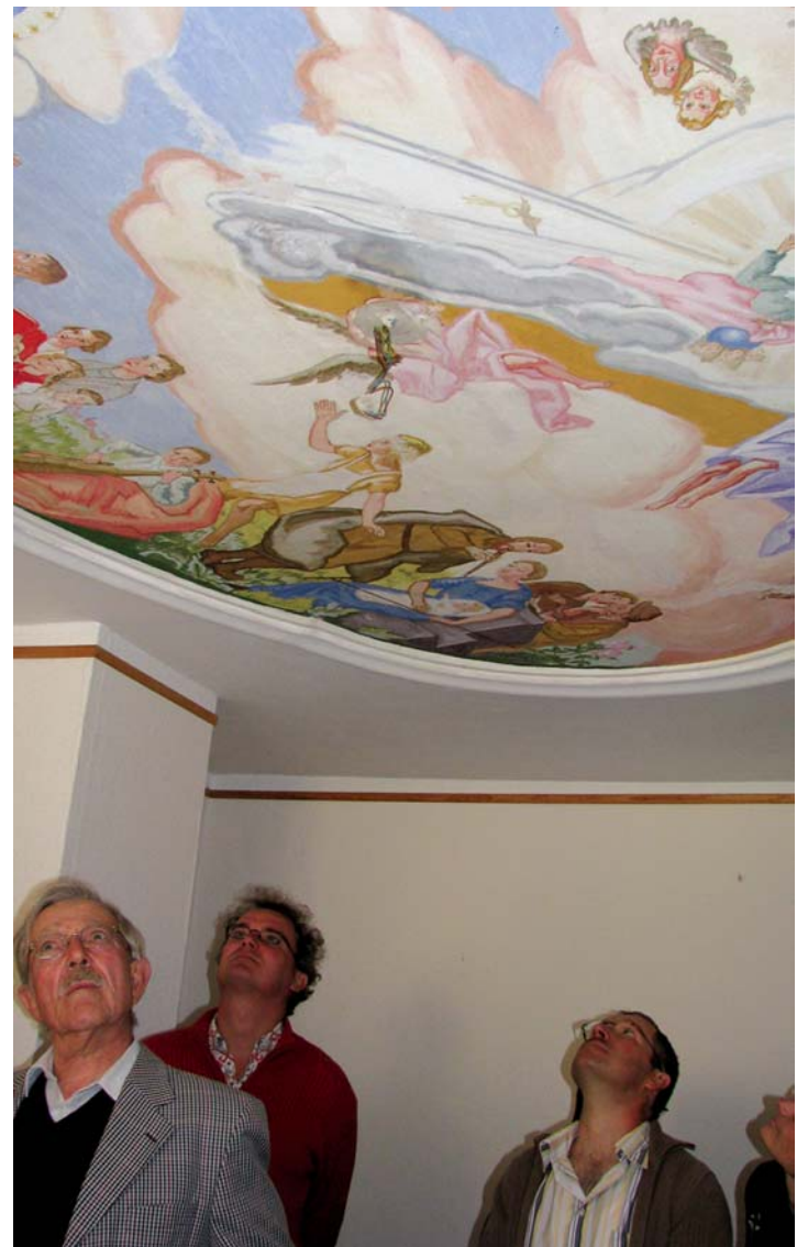
Bei der Besichtigung des ehemaligen Pfarrhauses in Biesendorf ziehen unter anderem beeindruckende Deckenmalereien den Blick auf sich.

Eine Anmeldung für den Tag des offenen Denkmals ist - außer für das ehemalige Pfarrhaus in Biesendorf - nicht erforderlich.