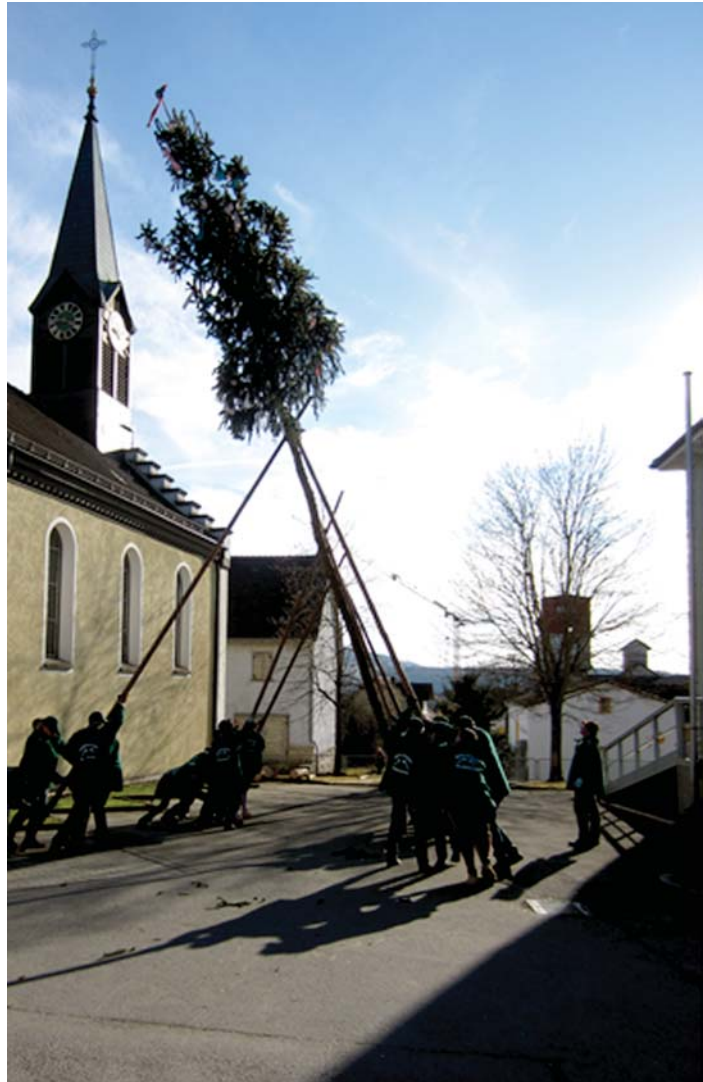
Fester Programmpunkt bei den Neuhauser »Bomsetzern« am Schmutzigen Dunschtig ist das Stellen des Narrenbaums am Bürgerhaus.

Wer jetzt jedoch denkt, dass diese nur zur fastnachtlichen Zeit unterwegs sind, irrt. Seit 2013 schmückt ein Maibaum den Dorfplatz über den Sommer hinweg, welcher von den Bomsetzern in unzähligen Arbeitsstunden und aufwendiger Handarbeit geschlagen, geräpelt, abgeschliffen sowie bemalt wird. Auch treffen sich die Bomsetzer jährlich zum traditionellen Spechelefest, bei dem der Narrenbaum mit mühevoller Manneskraft zersägt und zu Spechele verarbeitet wird.