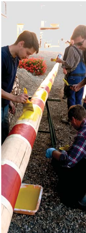
Seit 2013 sind die »Bomsetzer« auch in Sachen Maibaum aktiv.

Natürlich ist auch für das leibliche Wohl bestens gesorgt. Hierbei bietet die NZ Neuhausen neben ihrem beliebten Bur-