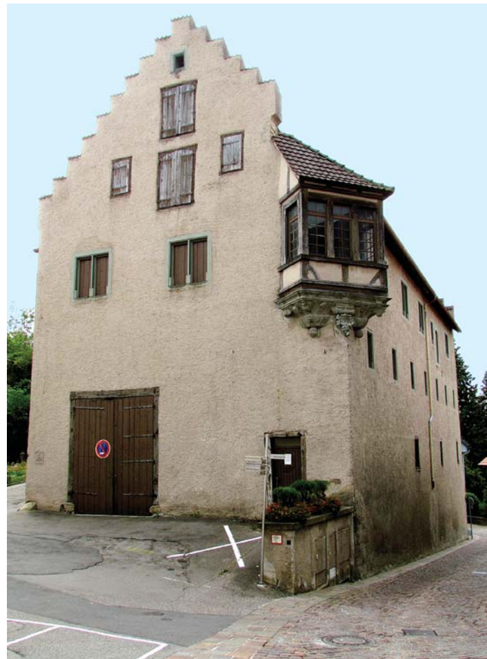
Das historische Kornhaus zählt in der Engener Altstadt zu den wenigen Gebäuden, die noch keiner Sanierung unterzogen wurden.

Die Beantragung der Sanierungsmittel soll nach Aussage von Geissler im Oktober erfolgen, mit der Entscheidung über die Bewilligung sei voraussichtlich im April nächsten Jahres zu rechnen. »Es ist ein sehr großes Programmpaket herausgekommen, in das viele Anregungen von Bürgern aufgenommen wurden«, zeigte sich Bürgermeister Johannes Moser beeindruckt und beurteilte es als sehr wichtig, »den Bürgern und vor allem den Eigentümern zu zeigen, welche Aufwertung eine Sanierung bedeutet«.