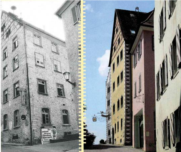
Der Engener »Pappenheimer« vor und nach der Restaurierung.