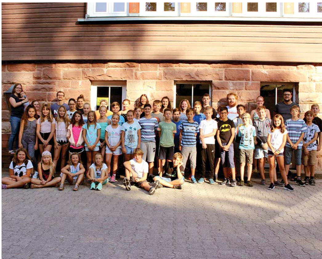
Viel Spaß und Abwechslung wurde den jungen Teilnehmerinnen und Teilnehmern bei der Ferienfreizeit im Schwarzwald vom ehrenamtlichen Leitungsteam der Seelsorgeeinheit Oberer Hegau geboten.