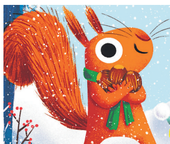
„Der Schneedieb“ wird in der Bib vorgelesen.

so eine Schneeballschlacht ist wirklich toll. Doch als es am nächsten Morgen begeistert aufwacht und sich auf noch mehr tolle Spiele im Schnee freut, ist die weiße Pracht auch schon wieder weg. Eichhörnchen ist sich sicher: Hier treibt ein frecher Schneedieb sein Unwesen! Ob der auch die geliebten Haselnüsse geklaut hat?