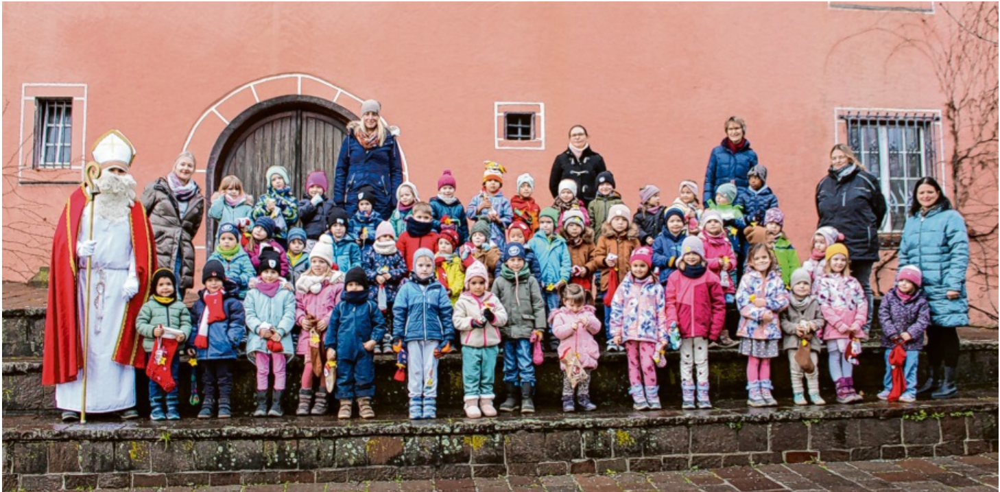
„Guter Bischof Nikolaus“ sangen die Kinder des Kindergarten St. Wolfgang als sie ihm hinter dem Rathaus begegnet sind. Der Bischof Nikolaus freute sich sehr, dass die Kinder einiges über seine guten Taten erzählen konnten. Nachdem sie ihm ein Fingerspiel vorgespielt und Nikolaus- und Adventslieder vorgesungen haben, bekamen sie noch ein kleines Geschenk aus seinen Jutesäcken.