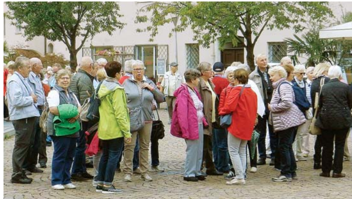
Eine abwechslungsreiche Entdeckungsreise durch das vielfältige Wipptal mit seinen Seitentälern zwischen Innsbruck und dem Brenner erlebte die Gruppe des VdK-Ortsverbands Oberer Hegau.

Die Verantwortlichen des VdK freuen sich auf eine Anmeldung für das Jahr 2018 vom 10. bis 13. September unter dem Motto »Spessart mit Räuberüberfall«.