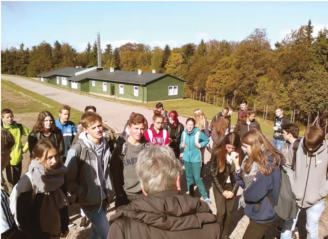
Erschütternde und nachdenklich stimmende Eindrücke erhielten Schülerinnen und Schüler der 10. Klasse des Gymnasiums Engen bei der Besichtigung des ehemaligen Konzentrationslagers »Struthof« in Natzweiler und der Kriegsgräberstätte Bergheim.