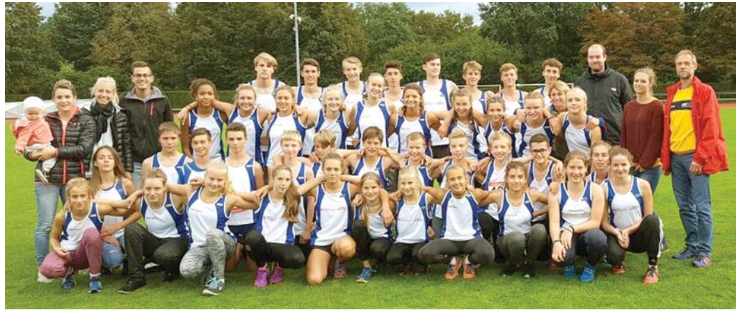
Beim Schülervergleichswettkampf waren viele Teilnehmer aus Engen dabei und erfolgreich.

Mitspielen oder Reinschnuppern ist immer sonntags ab 10:30 Uhr im Alten Stadtgarten in Engen möglich. Anmeldung nicht erforderlich.