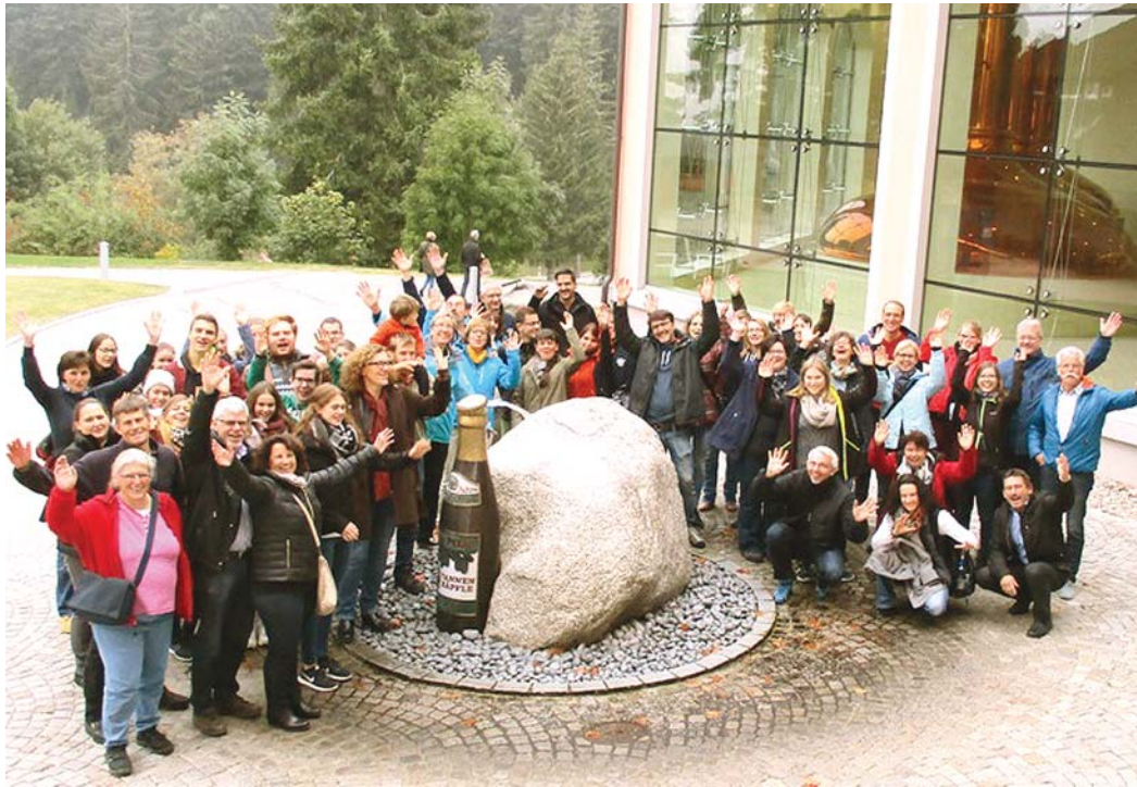
Eine Brauerei-Führung ließ sich die Stadtmusik Engen während ihres Ausflugs natürlich nicht entgehen.