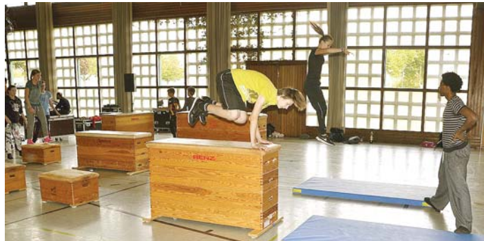
Einen anspruchsvollen Parcours galt es, beim gleichnamigen Workshop zu bewältigen.