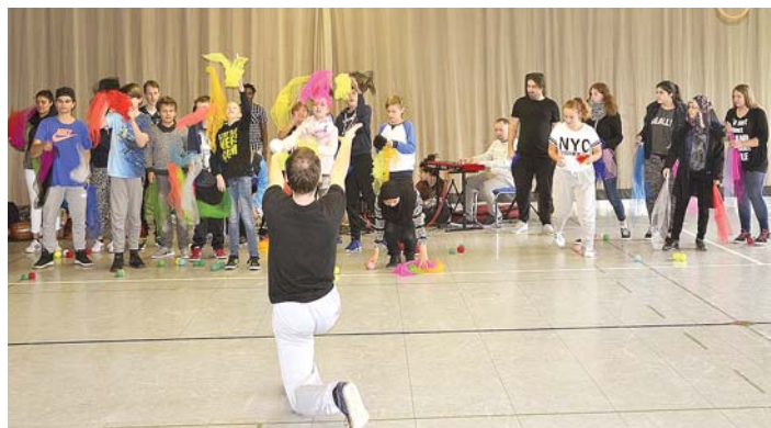
Geschicklichkeit war gefragt beim Workshop Jonglieren.