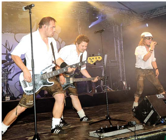
Die »Baaremer Luusbuäbä« werden das Festzelt in Ehingen am 25. September rocken.