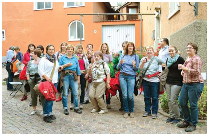
Auch die auswärtigen Gäste bewunderten und lobten das Engagement der Mitwirkenden sehr. In den beim Weinausschank aufgestellten Spendenkassen kamen insgesamt 180 Euro zusammen. Diese Summe werden die Anwohner an einen wohltätigen Zweck weiterleiten.