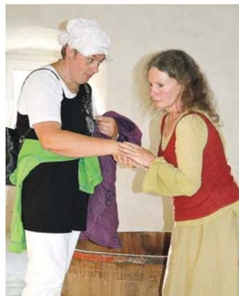
Die Bademagd zelebrierte in der historischen Badstube die Bräuche und Sitten aus dem 15. Jahrhundert. Die Gäste konnten den »Wellness-Effekt« der damaligen Zeit hautnah erleben.