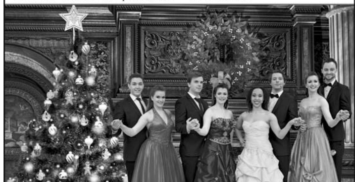
„A Musical Christmas“ kommt am 26.12. nach Engen

Tickets: www.resetproduction.de / 0365 - 5481830, in der Touristinformation Marktpassage/Stadthalle in Singen sowie an allen bekannten VVK-Stellen.