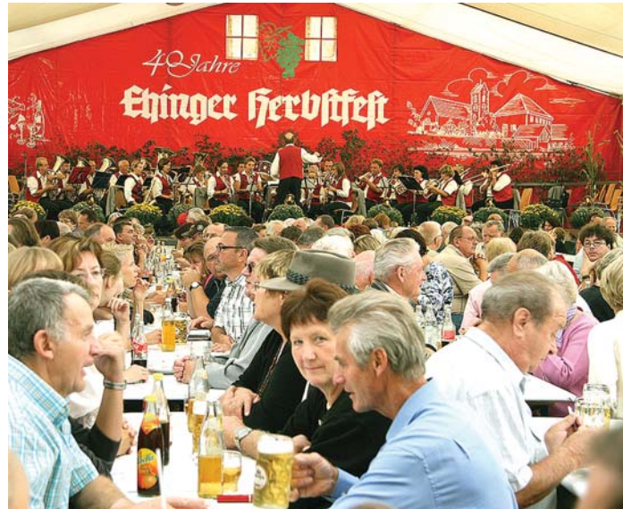
Gäste aus der weiteren Region nutzen beim Ehinger Herbstfest die Gelegenheit zur ersten Schlachtplatte der Saison.