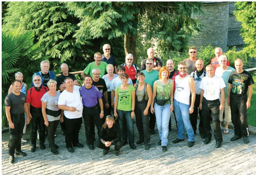
Ins Tessin führte die elfte Motorradtour des Schwarzwaldvereins Engen am letzten August-Wochenende. 30 Biker nahmen an der abwechslungsreichen Fahrt teil.

Alle drängten schon darauf, die nächstjährige Tour in Angriff zu nehmen. Ende Oktober wird bei entsprechenden Wetterverhältnissen nach einer kleinen Saisonabschluss- und anschließendem Raclette im Hause Kamenzin die Nachlese gehalten.