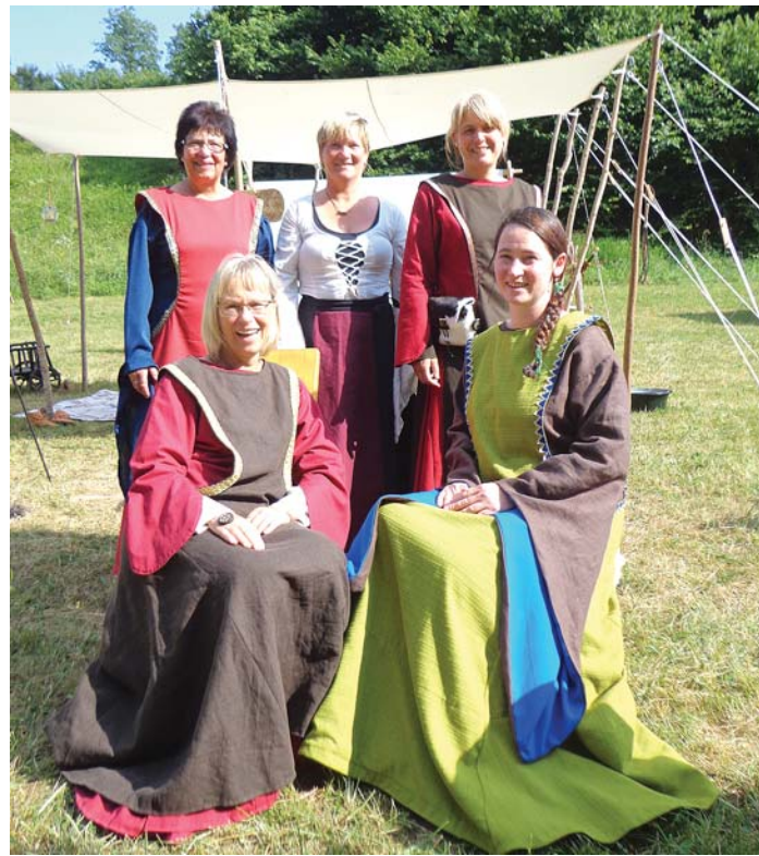
Viel Geschick mit Nähmaschine, Nadel und Faden stellten die Teilnehmerinnen des Nähkurses »Mittelalterliches Gewand« der Landfrauen Stockach-Engen unter Beweis.