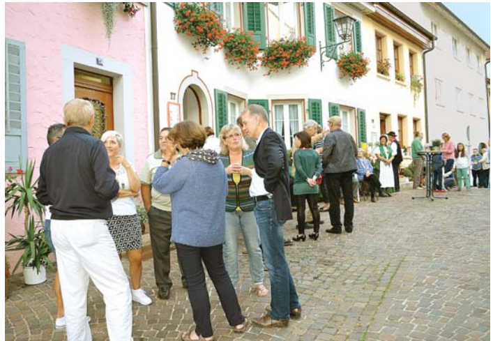
Bei einem Gläschen Wein fanden an diesem lauen Spätsommerabend viele nette Gespräche zwischen Anwohnern und Gästen statt. Zwischen den zahlreich anwesenden Engenern wurden Erfahrungen ausgetauscht.