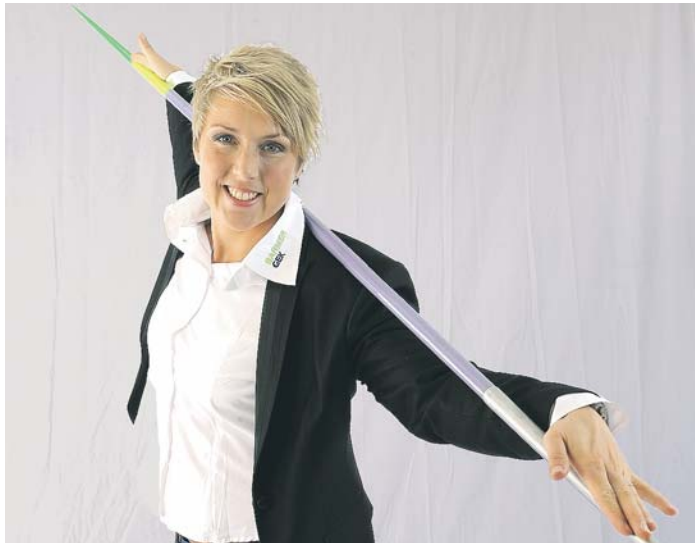
Christina Obergföll wird bei der Sportlerehrung am Freitag, 28. November, als Gastrednerin auftreten. In der Zeit von 16 bis 17 Uhr wird sie eine öffentliche Autogrammstunde in der Engener Filiale der Volksbank eG Schwarzwald Baar Hegau abhalten.