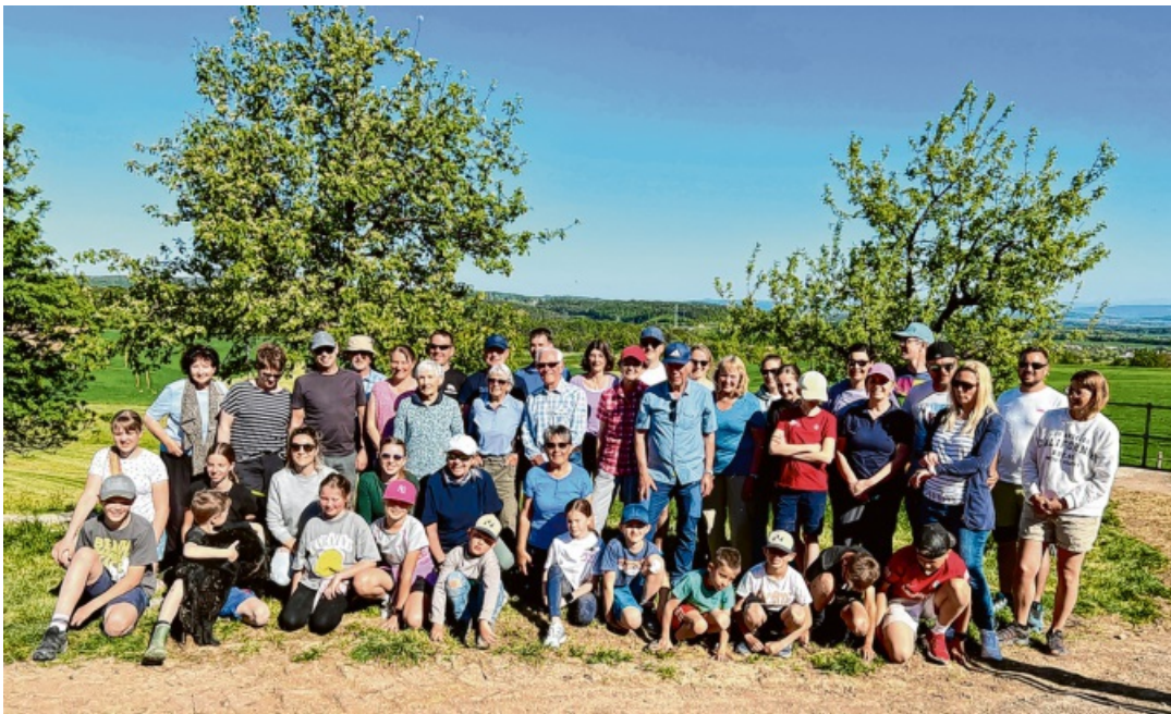
Groß und klein verlebten einen super Tag bei der Maiwanderung des Engener Skiclubs.

Engen. Eine höchst erfreulich große Anzahl von Mitgliedern des Skiclubs Engen traf sich bei schönstem Sommerwetter zur traditionellen Wanderung am 1. Mai.