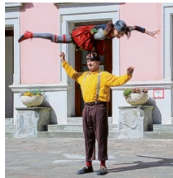
... gaben Kostproben ihres artistischen Könnens ...