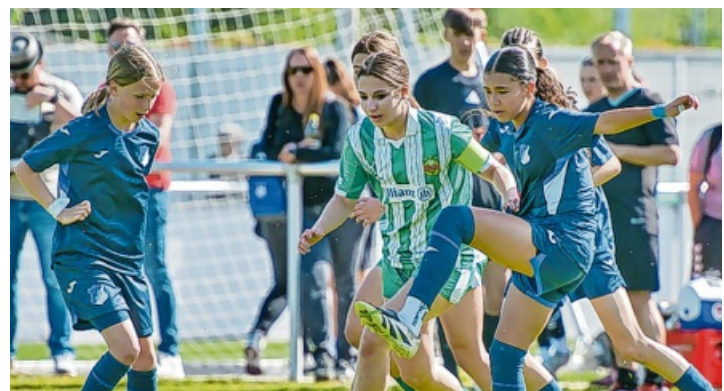
Action auf dem Feld beim Förster Supercup.

pers Zürich reisten in den Hegau. Die U14 Juniorinnen des Hegauer FV schaffte es mit einem Sieg im Elfmeterschießen im Halbfinale gegen den VfB Stuttgart bis ins Finale und mussten sich dort der TSG Hoffenheim geschlagen geben. Am Sonntag folgte dann das Turnier der U12 Junioren mit zahlreichen Zuschauern. Beide Turniere wurden auf drei Plätzen parallel gespielt. Am Sonntag setzte sich der VfB Stuttgart im Finale gegen SK Rapid Wien durch, Dritter wurde der SC Freiburg.