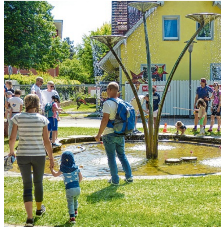
Neben einer Servicestation und vielen anderen Aktivitäten gibt es auch in diesem Jahr wieder das beliebte Entenangeln für die Kleinen und Großen.