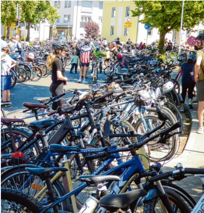
Gottmadingen ist ein beliebter Zwischenstopp auf der 38 Kilometer langen Strecke.

Der slowUp-Auftakt beginnt traditionell am Samstagabend, wenn um 18 Uhr die „Original Aussteiger“ aufspielen und für Gemütlichkeit und gute Laune sorgen. Die Küche ist bereits geöffnet und auch die Zapfhähne sind offen, sodass es an nichts fehlen wird. Am Sonntag selbst geht es dann in die Vollen: Ein abwechslungsreiches Rahmenprogramm und gute Verpflegung sorgen für einen großartigen Tag voller Bewegung, guter Laune und geselligem Beisammensein. Nicht nur spielt eine Oldies-Band, sowohl der TuS als auch das Tanzwerk 95 präsentieren sich und ihre Tänze. Entenangeln, Spiel und Spaß mit den Naturfreunden Gottmadingen und ihrer Fledermausstube, Spiele und Basteln mit der Abteilung für Jugend, Familie und Soziales der Gemeindeverwaltung und das beliebte Kinderschminken runden das Angebot ab. Radelnde und Besu-