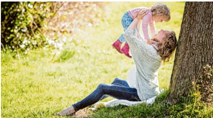
Am 10. Mai ist Muttertag, ein schöner Anlass, seiner Mutter etwas zu schenken.

am spendabelsten - sie geben im Schnitt bis zu 40 Euro für Muttertagsgeschenke aus. Menschen über 40 investieren hingegen etwas weniger und liegen bei circa 30 Euro. Unabhängig vom Budget bleibt eines konstant: Blumen sind das beliebteste Muttertagsgeschenk. Ein Viertel der befragten Männer setzt auf den klassischen Muttertagsstrauß. Platz zwei belegt der Gutschein für ein gemeinsames Erlebnis, das klassische Schokoladen-Geschenk landet auf dem dritten Platz.