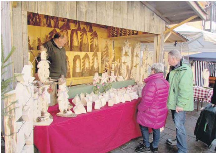
An knapp hundert Verkaufs- und Bewirtschaftungsständen wartet eine große Auswahl auf die Weihnachtsmarktbesucher.

Punsch und Glühwein schmecken natürlich ganz besonders gut, wenn die heißen Getränke im liebevoll gestalteten »Original Engener Henkelbecher« kredenzt werden, der an verschiedenen Marktständen zum Preis von 2,50 Euro käuflich erworben werden kann.