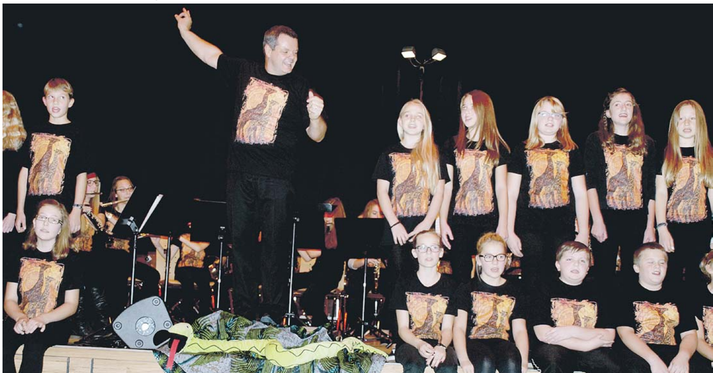
Eine große Gemeinschaft: Zum Song »Siyahamba« kam die Bläserklasse 6 aufs Podium und unterstützte die Jugendkapelle. Musiker und »Sänger« hatten eigens für den afrikanischen Abend Motto-T-Shirts drucken lassen.