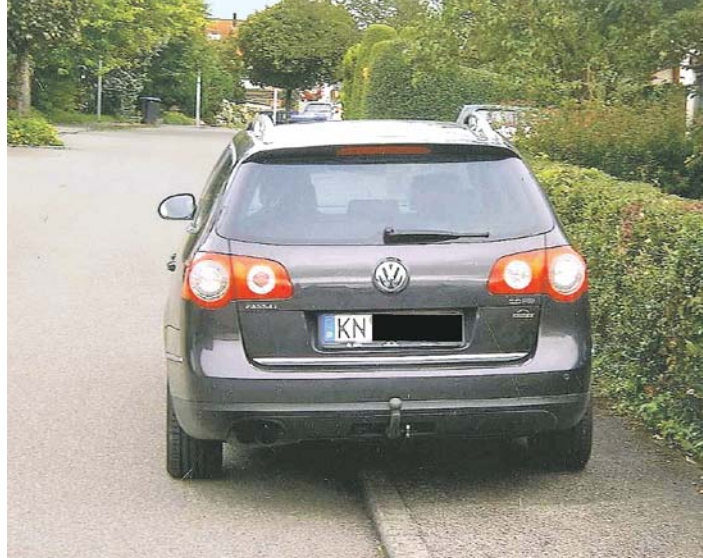
Auf diesem Gehweg im Scheurenbohl kommt kein Fußgänger vorbei - erst recht nicht mit Rollator oder Kinderwagen. Wenn so geparkt wird, haben Fußgänger das Nachsehen.

zu wächst. Deshalb auch hier der Appell an Grundstückseigentümer, ihre Hecken zu kontrollieren und den Überwuchs zu entfernen.