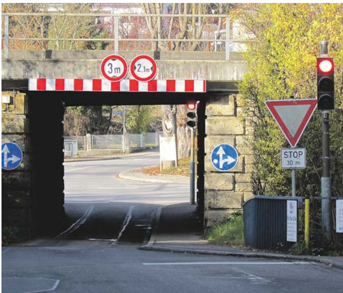
Die Zeichen stehen auf Rot: Einstimmig beschloss der Gemeinderat in der vergangenen Woche, von einem Aufweitungsbegehren an die Bahn für die Eisenbahnüberführung Ballenberg Abstand zu nehmen.

Rechtlicher Schutz für bauliche Anlagen gegenüber nachträglichen staatlichen Anforderungen, das heißt, bestehende Anlagen/Gebäude, die nach früher geltendem Recht rechtmäßig errichtet wurden, dürfen erhalten und weiter genutzt werden, auch wenn sie dem heute gültigen Baurecht nicht mehr entsprechen.