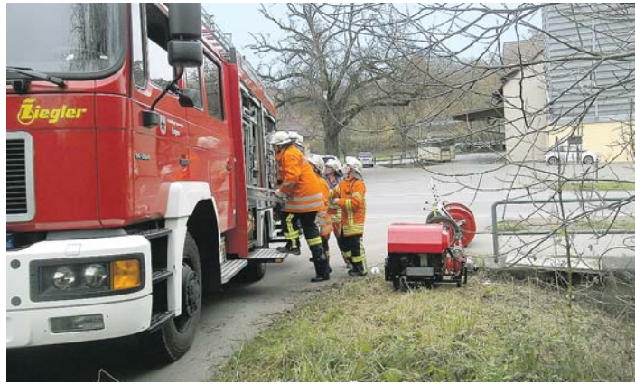
Die Anselfinger Wehrmänner demonstrierten bei der Jahreshauptprobe überzeugend ihr Können.

Anselfingen. Die Senioren Anselfingen treffen sich am Montag, 1. Dezember, um 14.30 Uhr im Bürgerhaus in Anselfingen zu einem gemütlichen Nachmittag.