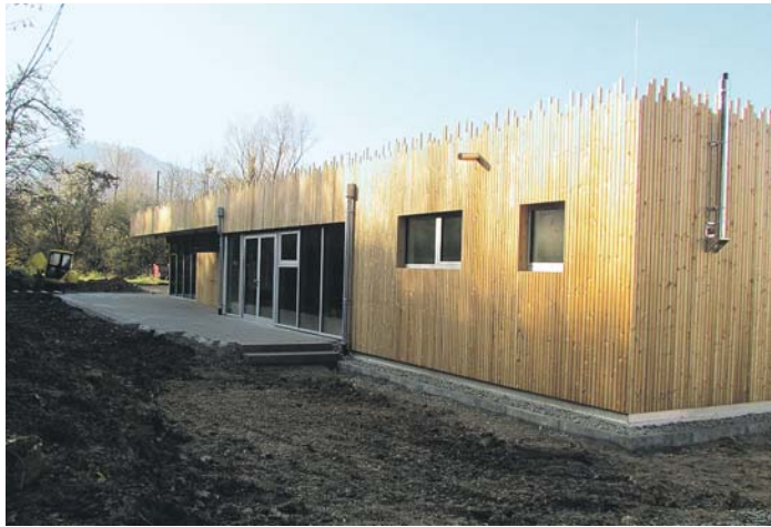
Viel Platz und Bewegungsfreiheit gewähren an der Kinderkrippe »Im Baumgarten« die große Terrasse und ein Spielgarten.

»Für die Erhebung der Elternbeiträge zur Kinderbetreuung gibt es eine gemeinsame Empfehlung der Kirchen und der kommunalen Landesverbände,