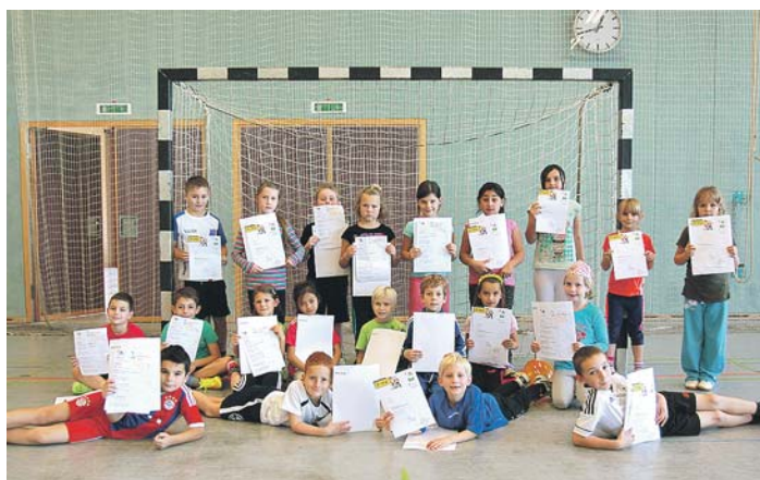
Am vierten Grundschulaktionstag des TV Ehingen in Sachen Handball nahmen auch die Zweitklässler der Grundschule Welschingen teil.

Bereits zum vierten Mal in Folge legten am 7. November 83 Mädchen und Jungen der zweiten Klassen aus den Grundschulen Mühlhausen-Ehingen, Volkertshausen und Welschingen das AOK-Spielabzeichen beim TV Ehingen ab. Um das Spielabzeichen zu bekommen, absolvierten die Kids nach der Begrüßung und einem kurzen Handball-Regelfilm sechs Koordinationsstationen und bewiesen bei der Spielform »Aufsetzer-Handball« ihr Können. Zwischendurch gab es auch eine kleine Stärkung in Form von Getränken und frisch gebackenen Brezeln im Foyer der Eugen-Schädler-Halle. Den Abschluss der gelungenen Veranstaltung bildete die Siegerehrung, bei der alle das erreichte AOK-Spielabzeichen, ein Handball-Regelheft und Geschenke des TV Ehingen erhielten. Die Handball-Abteilung würde sich freuen, wenn einige Kinder Gefallen am Handballsport gefunden hätten und das Angebot eines oder auch mehrerer Probetrainings annehmen würden. Alle Informationen sowie Bilder von diesem Tag unter www.tv-ehingen.de .