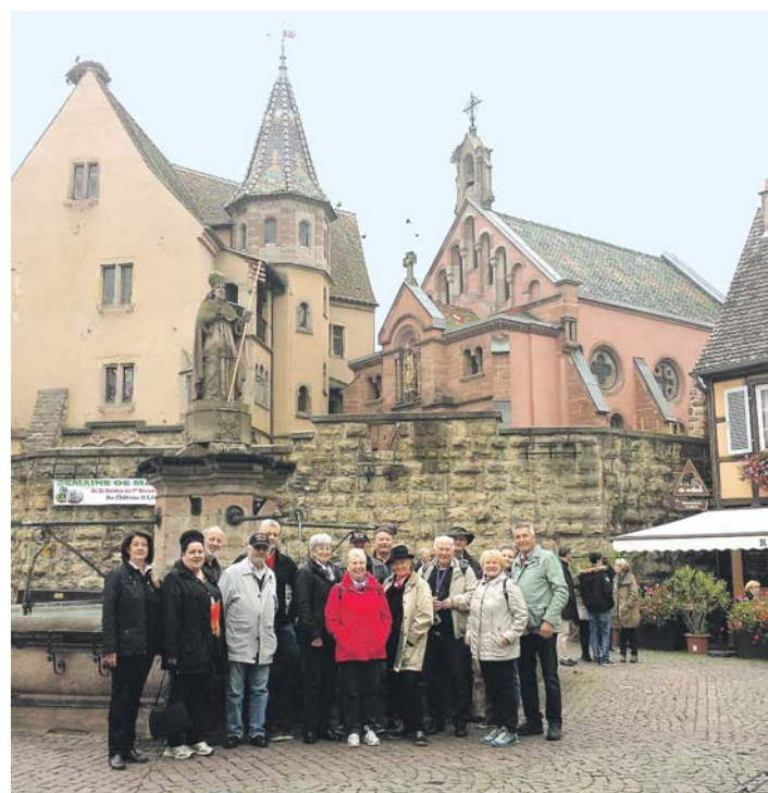
Eine kulinarische Busreise nach Eguisheim an der elsässischen Weinstraße gönnten sich die Pilzf Freunde Engen. Hier drehte sich alles rund um Pilze. Eine anschließende Weinprobe auf einem nahe gelegenen Weingut rundete den Ausflug ab.