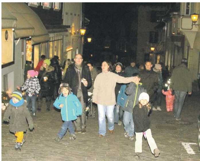
Er fasziniert Jung und Alt immer wieder von neuem: der Lichterabend in der Altstadt und der angrenzenden Breitestraße.