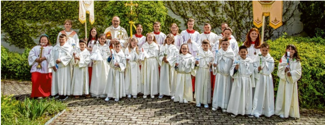
In Welschingen am 26. April.

Im Oberen Hegau wurden vier feierliche Gottesdienste mit insgesamt 85 Kindern gefeiert