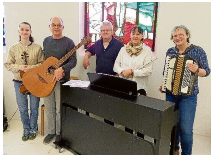
Die Band „Um Himmels Willen“.

Besonderer Gottesdienst mit Musik am Klinikum Singen