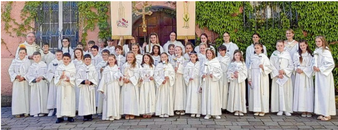
In Engen am 9. Mai.