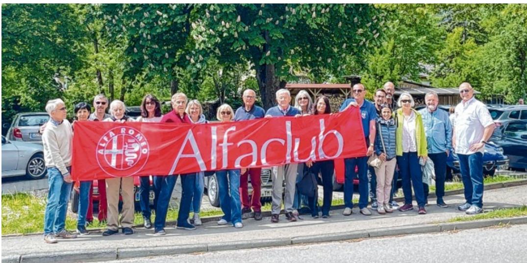
ADie gut gelaunten Hegau-Ausfahrer des Alfaclubs,

Alle Aktiven und der Vorstand des TTV Anselingen freuen sich auf eine rege Teilnahme und auf viele Gäste.