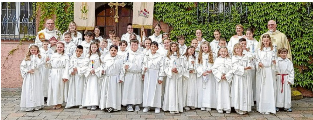
In Engen am 10. Mai.