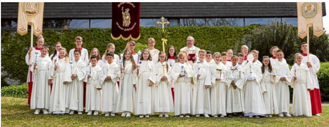
In Welschingen am 3. Mai.