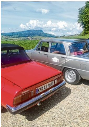
Chice Schlitten vor toller Kulisse.

Engen. Der Wettergott war den Alfas hold - bei dem durchweg sonnigen Sonntag führte die Tagestour quer durch den Hegau. Vom Treff-