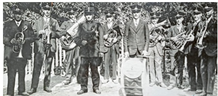
Die Musiker des Musikvereins Schlatt a.R. zwei Jahre nach der Gründung im Jahre 1928

Nach weiteren drei Zugängen trat man ab 1930 in der näheren und weiteren Umgebung bis zum Ausbruch des Krieges mit 11 Mann auf. Nur wenige Schriftstücke aus der Zeit von 1926-1945 blieben erhalten, denn die schriftlichen Unterlagen des Vereins befanden