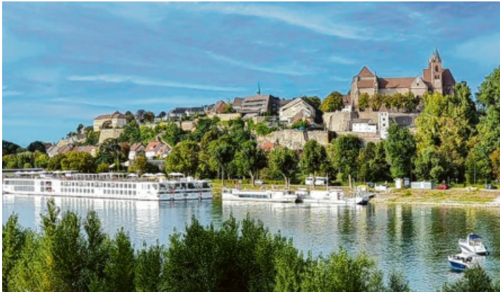
Der Münsterberg Breisach vom französischen Ufer gesehen.

Ein schöner Tag in Breisach und auf dem Rhein