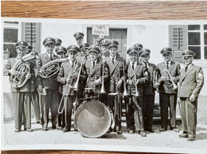
Der Musikverein Schlatt a.R. präsentiert im Jahre 1958 vor einem Auftritt im schweizerischen Thayngen seine erste Uniform.

Das ganze Dorf feiert seinen Musikverein