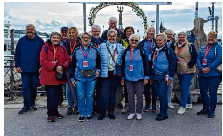
Die Teilnehmerinnen und Teilnehmer blicken auf einen rundum gelungenen Ausflug zurück.

Ein besonderes Highlight des Tages war die beeindruckende Turngala 60plus, die die Besucherinnen und Besucher begeisterte.