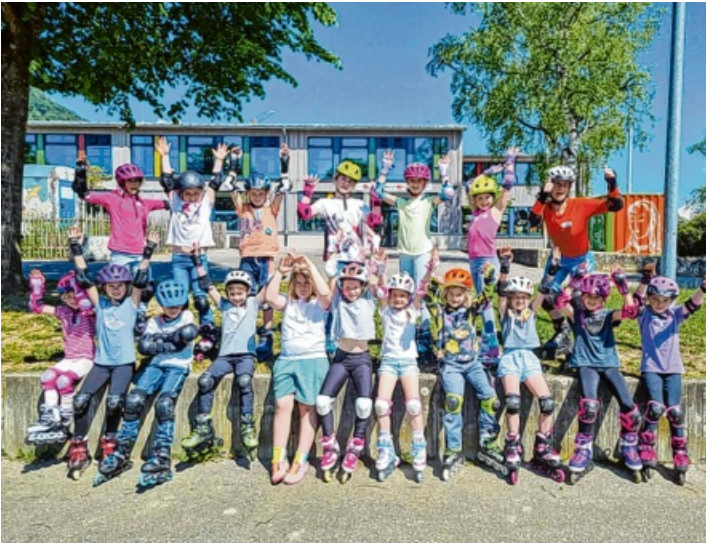
„Yeah! Jetzt sind wir auf unseren Inlinern sicher unterwegs“, freuten sich die Kids nach dem Kurs.

Engen. Bei strahlendem Sonnenschein fand am 9. Mai von 10 bis 12 Uhr der Inline-Kurs der TG Welschingen an der Hohenhewenhalle in Welschingen statt. Insgesamt nahmen 17 Kinder mit viel Freude und Motivation an dem abwechslungsreichen Vormittag teil. Zu Beginn standen wichtige Brems- und Fallübungen auf dem Programm, damit die jungen Inliner sicher unterwegs sind. Anschließend