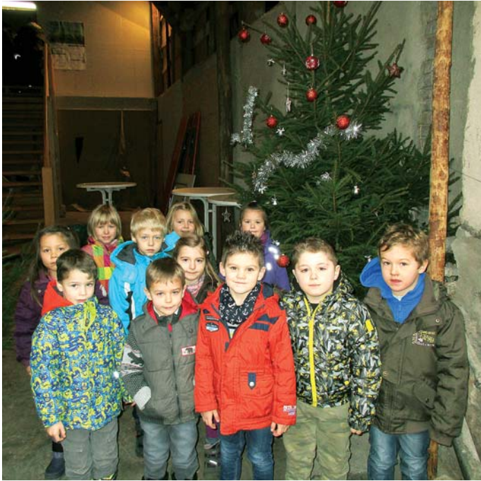
Begeisterte Zuschauer beim Weihnachtsbilderbuch »Der Weihnachtsstern« im Kornhaus waren die Vorschulkinder des Kindergartens Welschingen am 11. Dezember.