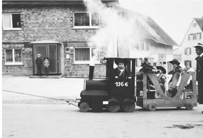
Die Tradition des Fasnetmäntig-Umzugs will die Rolli-Zunft zum Jubiläum wieder zum Leben erwecken.

Anmeldungen nimmt Zunftmeister Werner Kohler gerne entgegen.