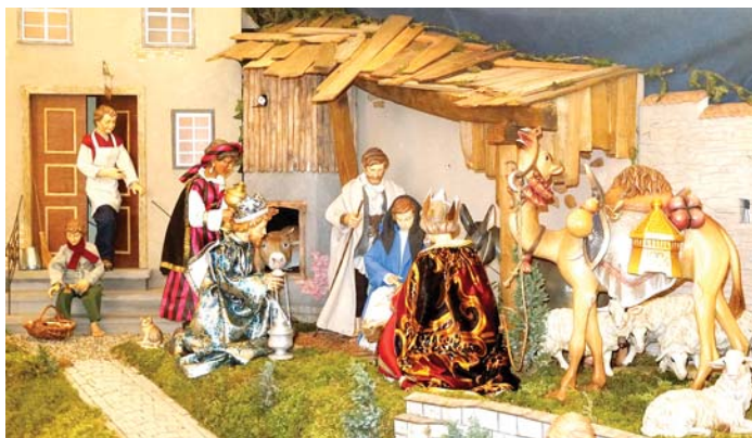
Bis Dreikönig ist die »lebendige« Krippe in der Stadtkirche St. Nikolaus in Aach zu besichtigen.