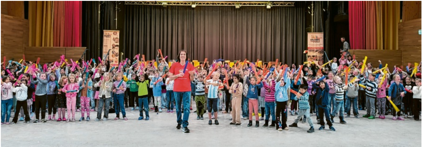
Begeisterung, Konzentration und gemeinsames Erleben - das war die „Trommelwoche“ an der Grundschule Engen, die mit dem gemeinsamen Vorspiel einen gelungenen Schlusspunkt setzte.

In der vergangenen Woche verwandelte sich die Grundschule Engen in ein wahres Trommelparadies. Unter der Anleitung von Uwe Pfauch vom Erlebnistrommeln lernten die Schülerinnen und Schüler, was es bedeutet, im gleichen Rhythmus zu spielen - und wie viel Spaß gemeinsames Musizieren machen kann.