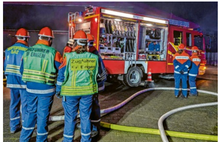
Üben unter realen Bedingungen - dazu gehört auch der Einsatz von zur Übungsannahme passenden Fahrzeugen.