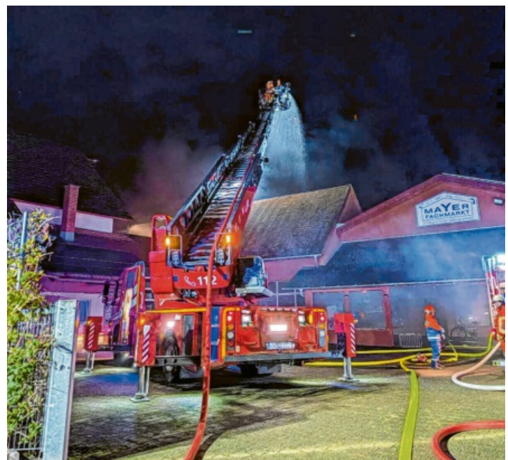
Spektakulär: Selbst die Drehleiter kam zum Einsatz.