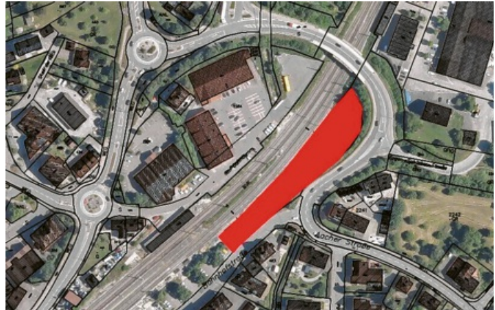
Im rot gefärbten Bereich soll der Parkplatz entstehen. Die Fertigstellung ist für Sommer 2026 geplant.

bei der Maßnahme zukommen: Aufgrund der Hochwasserkartierung darf für den Fall eines 100-jährigen Hochwassers die Höhe des Geländes nicht verändert werden. Das heißt, der Bahndamm, der im Zweiten Weltkrieg unter Beschuss stand, musste auf Altlasten und Kampfmittel im Boden untersucht werden. Auch der Talbach-Kanal muss teilweise saniert werden - zumindest auf der städtischen Seite, dafür laufen Planungen. Die Bahn hatte ihren unter den Gleisen verlaufenden Kanalteil 2019 in einer spektakulären Großmaßnahme saniert (Bild rechts). „Parkplatzbau hört sich erst mal langweilig an, aber er ist der Auftakt der Großsanierung und die nachfolgenden Maßnahmen sind davon abhängig“, erklärte Bürgermeister Frank Harsch. „Schön, dass wir Bürger haben, die die Planungen aktiv mitverfolgen“, sagte er mit Blick auf das zahlreich erschienene Publikum. Matthias Distler machte deutlich, dass auch im Zuge der Maßnahmen der Bahn (Querung) und im Innenstadtbereich Parkplätze wegfielen. „Deshalb wollen wir Ersatz bereithalten“, so Distler. Er präsentierte außerdem eine Statistik, nach der viele Pendler Richtung Süden fahren. Somit würde sich auch ein größeres Parkangebot am Bahnhof Welschingen anbieten. „Langfristig brauchen wir noch weitere Parkplätze zur Überbrückung“, sagte er.