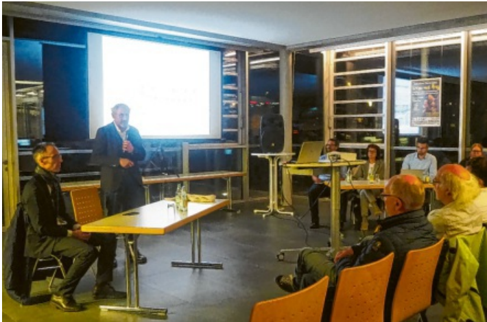
Die Einwohnerversammlung fand im Stadthallen-Foyer statt.

Die Stadtverwaltung informierte in Einwohnerversammlung über den geplanten Parkplatz am Bahnhof