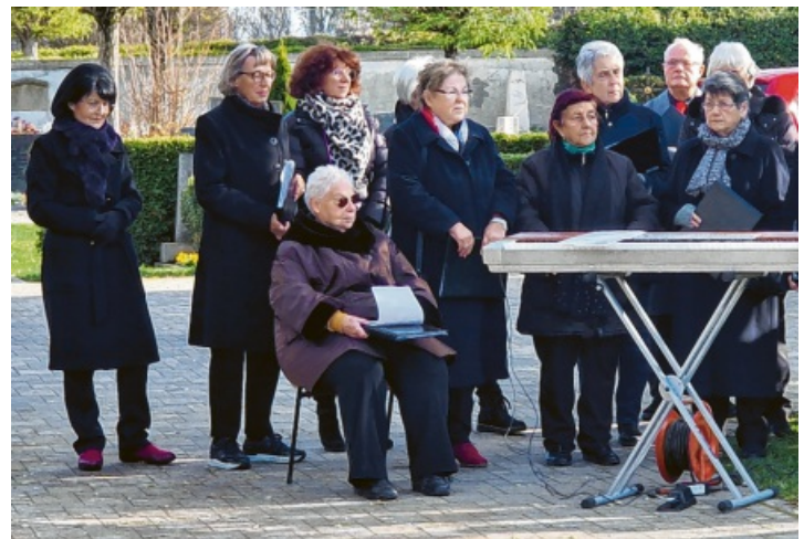
Volkstrauertag: Gemeinsam mit der Stadtmusik Engen begleitet der Stadtchor Engen mit den Philianer den diesjährigen Volkstrauertag am kommenden Sonntag, 16. November, auf dem Friedhof in Engen. Beginn ist um 11.45 Uhr, der Stadtchor lädt dazu herzlich ein.