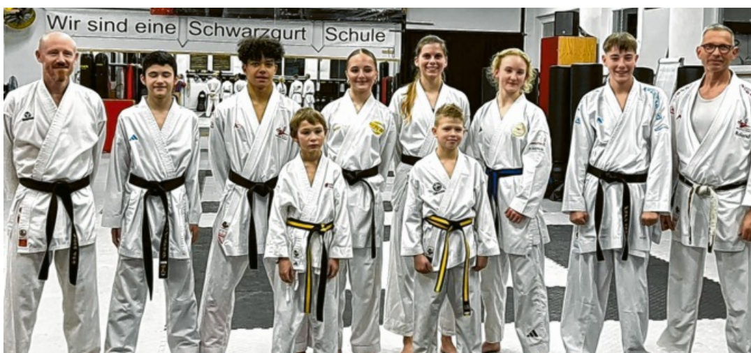
Viele Medaillen gab es für das Karate Team Hegau in Trier.

Karate Team Hegau holt 16 WM-Platzierungen