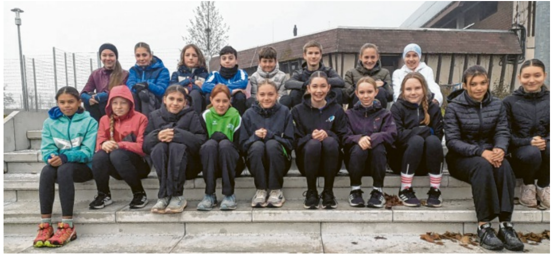
Auch bei schlechtem Wetter immer zum Training bereit: Die Leichtathletik-Talente.