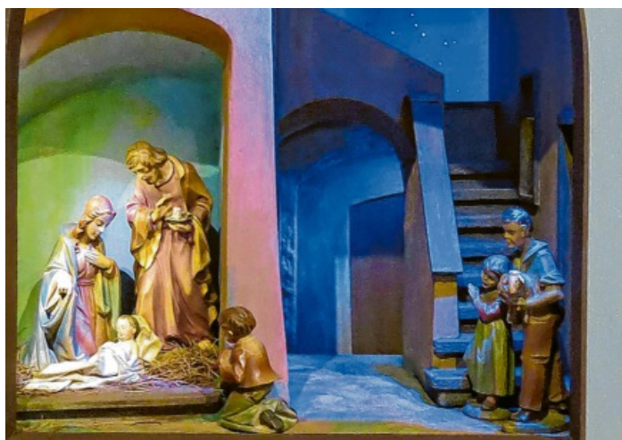
Christ-Nacht in der Via Dogali in Moneglia von Ulrich Scheller 2019.