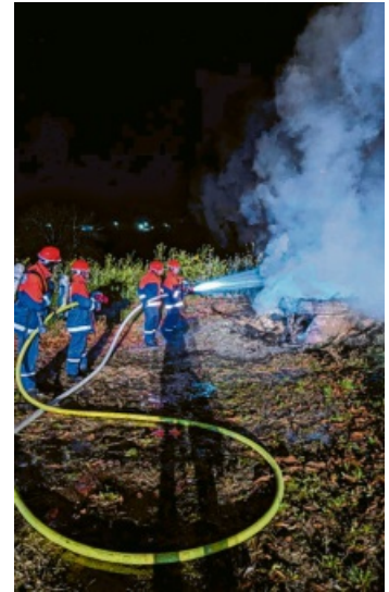
Wasser Marsch: Hier wurde das Löschen eines brennenden Grills geübt.

ihren Aufgabengebieten schicken. Während ein Großteil der Einheiten draußen beschäftigt waren, die verschüttete Person zu retten, löschten die restlichen Einheiten im verrauchten Innengebäude unter Atemschutz den Brand. Mit dieser Abschlussübung endeten die BF-Tage 2025. „Wir bedanken uns bei allen Helfern, Kameraden, Organisatoren, Jugendleitern, Eltern und Jugendlichen für die spannenden und ereignisreichen Tage“, heißt es von Seiten der FFW. Weitere Einblicke und Bilder der Jugendfeuerwehr gibt es auf Instagram unter: jugendfeuerwehr.engen