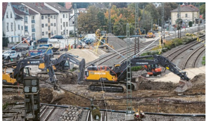
2019 wurde der Talbachkanal unter den Bahngleisen von der DB saniert. Die Anteile auf städtischem Gebiet werden noch begutachtet.

Da der Parkplatz Eselsbrücke vorrangig von Pendlern benutzt wird, macht eine Parkraumbewirtschaftung keinen Sinn. Das Parken ist vorerst kostenlos