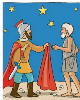
St. Martin teilt seinen Mantel mit einem armen Mann.

Partnerorganisationen vom Kindermissionswerk setzen sich dafür ein, dass diese jungen Menschen künftig zur Schule gehen dürfen.