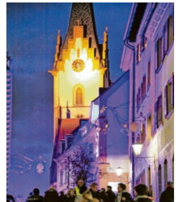
Fasziniert immer wieder von neuem: Der Lichterabend in Engen.

Bewirtung nutzen. Geplant ist unter anderem der Ausschank von selbst gebrautem Bier. Die Geschäfte der Altstadt haben an diesem Abend bis 20 Uhr geöffnet und freuen sich auf regen Besuch. Um die einzigartige Atmosphäre ungestört genießen zu können, ist die Altstadt in der Zeit von 16 Uhr bis 20.30 Uhr für den Fahrzeugverkehr gesperrt. Das Organisationsteam freut sich sehr, dass viele Altstadtbewohner ihre Häuser und Straßen liebevoll mit Kerzen und anderen natürlichen Lichtquellen schmücken und so zeigen, dass der Lichterabend ein Fest für alle ist.