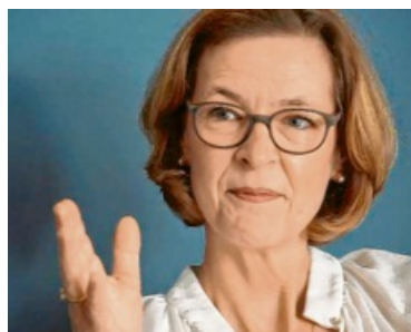
Beate Bube, Präsidentin des Landesamtes für Verfassungsschutz Baden-Württemberg, wird am Donnerstag, 20. November, um 19:30 Uhr im Rahmen der Stadtgespräche im Kornhaus zu Gast sein.

Verfassungsschutz hautnah - Gespräch mit der Präsidentin des Landesamtes für Verfassungsschutz Baden-Württemberg