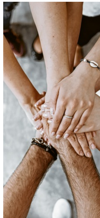
Teamwork - gemeinsam für eine starke regionale Wirtschaft.

Ab 12 Uhr gibt es jeweils zur vollen Stunde rund 20-minütige Impulsvorträge zu Themen rund um Wirtschaft und Gesundheit.