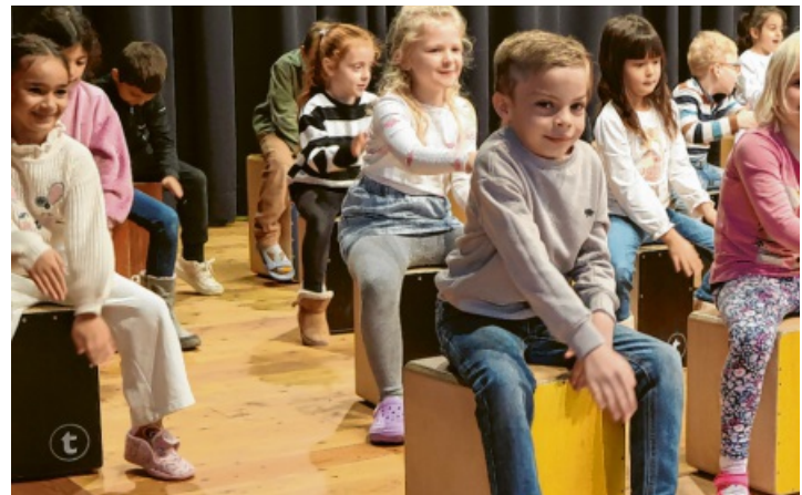
Mit Feuereifer waren die Kids dabei.

Mit über 100 Workshops jährlich begeistert der Musiker Kinder, Jugendliche und Erwachsene gleichermaßen. Sein speziell für Grundschulen entwickeltes Unterrichtskonzept basiert auf mehr als 25 Jahren Erfahrung und ermöglicht allen Teilnehmerinnen und Teilnehmern schnelle Lernerfolge - mit ganz viel