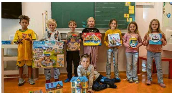
Bei „Spielen macht Schule“ gehörte die GS Engen zu den Siegern. Die Kinder freuen sich über die neuen Spielmöglichkeiten.

Die Grundschule Engen erhält Spielzimmer