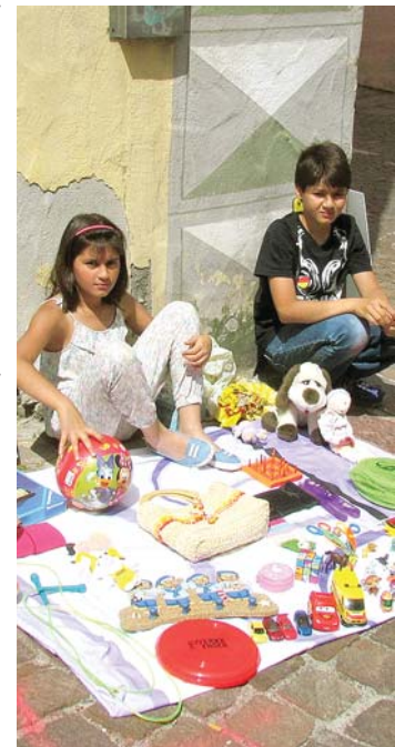
Ab 8 Uhr gibt es alljährlich auf dem Kinderflohmarkt ein lebhaftes »Feilschen« zwischen den jungen Händlern und Käufern.

Weg von der »üblichen« Festbewirtung gehen die Standbetreiber auch in diesem Jahr, weshalb als kulinarische Spezialitäten unter anderem auch Langosch, Crepes, Fisch-