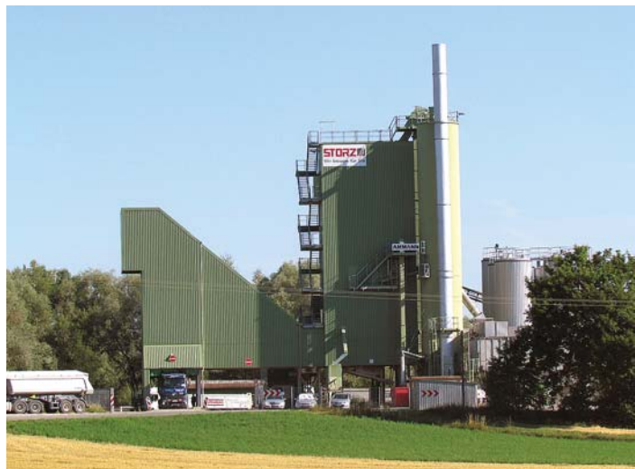
Die Asphalt-Mischanlage vor den Toren Welschingens in unmittelbarer Nachbarschaft der Sportanlagen und des Friedhofs war Thema in der jüngsten Gemeinderatssitzung. Mit zwei Enthaltungen stimmte der Gemeinderat vorsorglich dem Betrieb einer »Brecheranlage« nicht zu.