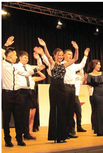
Bye-Bye sagten SchülerInnen der drei Abschlussklassen mit einer originellen Mischung aus verschiedensten Tanzstilen.