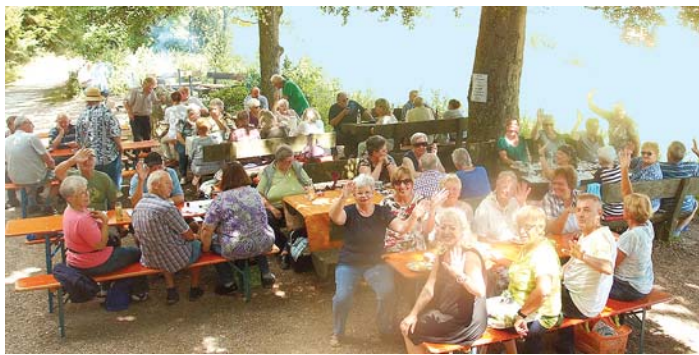
Zu den Höhepunkten zählt für die Mitglieder des VdK-Ortsverbands Oberer Hegau alljährlich das Grillfest. Dieses Jahr fand es an der Postweghütte oberhalb von Watterdingen statt.