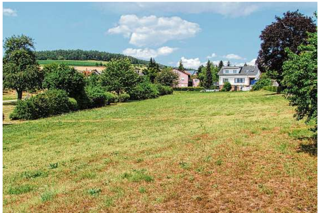
Auf einem Grünstreifen zwischen der bestehenden Bebauung und dem anschließenden Spielplatz »Hugenberg« sollen vier Bauplätze zur Bebauung mit Einfamilienhäusern entstehen.

berg« sei auch ohne die überplante Wiese sehr großzügig bemessen und gehöre zu den großen Spielplätzen der Stadt, so Distler. Er diene als Quartiersspielplatz und habe keine übergeordnete Funktion im Stadtgefüge. Im Interesse aller Anwohner sei es daher wichtig, dass der Spielplatz nicht zum zentralen Treffpunkt werde und dadurch für die vorhandene ausschließliche Wohnbebauung Unruhe und Belastungen durch nicht im Quartier wohnende Spielplatzbesucher entstünden. Diese Funktion obliege dem zentral an die Altstadt angegliederten Stadtpark mit einer Vielzahl an Freizeit- und Spielmöglichkeiten, erläuterte Distler. Hinsichtlich der beim Ortstermin offenbar stark diskutierten Dachform wies Distler darauf hin, dass das neue Baugebiet zwar an die Bebauung der Maierhalde aus den 60er- und 70er-Jahren anschliesse, aber in Material, Form und Farbe ohnehin eine zeitgemäße Architektursprache haben und sich somit von den vorhandenen Bauten absetzen werde. Durch die heute wieder aktuelle Gebäudestruktur mit Flachdächern und Attikageschoss könne ein für die Nachbarschaft niederer Baukörper entstehen.