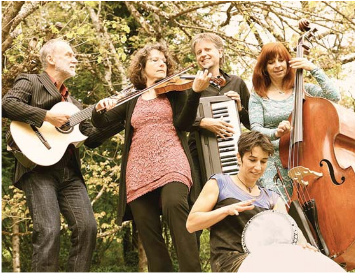
Die Konstanzer Band »Street Melody« wird am Samstag, 18. Februar, um 19.30 Uhr im Städtischen Museum Engen + Galerie Klezmer-Musik präsentieren.