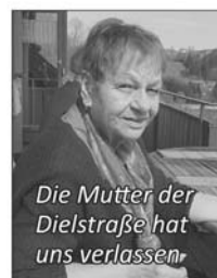
Die Mutter der Dielstraße hat uns verlassen

Ganz still und leise, ohne ein Wort, gingst du von deinen Lieben fort, du hast ein gutes Herz besessen, nun ruht es still, doch unvergessen; es ist so schwer, es zu verstehen, dass wir dich niemals wiedersehen.