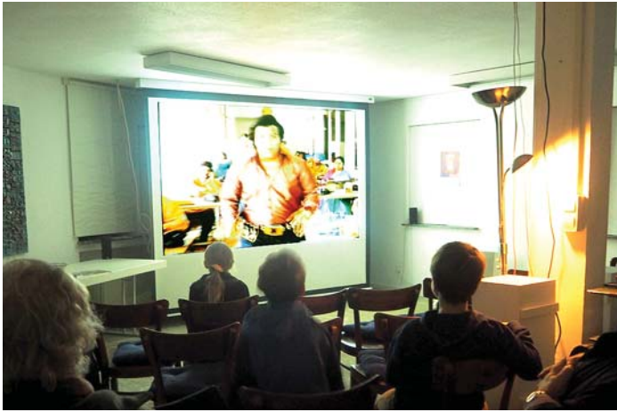
Nachdenkliches und phantasievolles Filmmaterial wurde bei der Engener Kurzfilmnacht kurz vor Weihnachten im Schützenturm präsentiert.