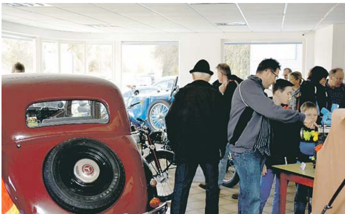
Viele Engener waren neugierig, welche Exponate der Oldtimer- und Museumsverein in seinem neuen Museum präsentiert.