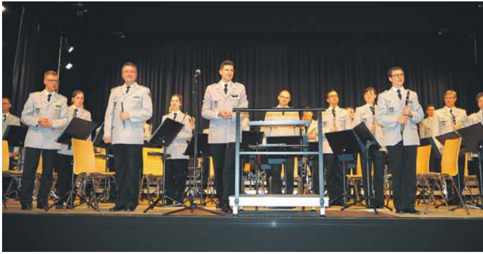
Viel Beifall ertete das Heeresmusikkorps Ulm in der Neuen Stadthalle.