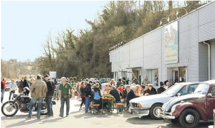
Bei tollem Wetter fanden viele Interessierte den Weg ins neue Oldtimermuseum nach Engen.