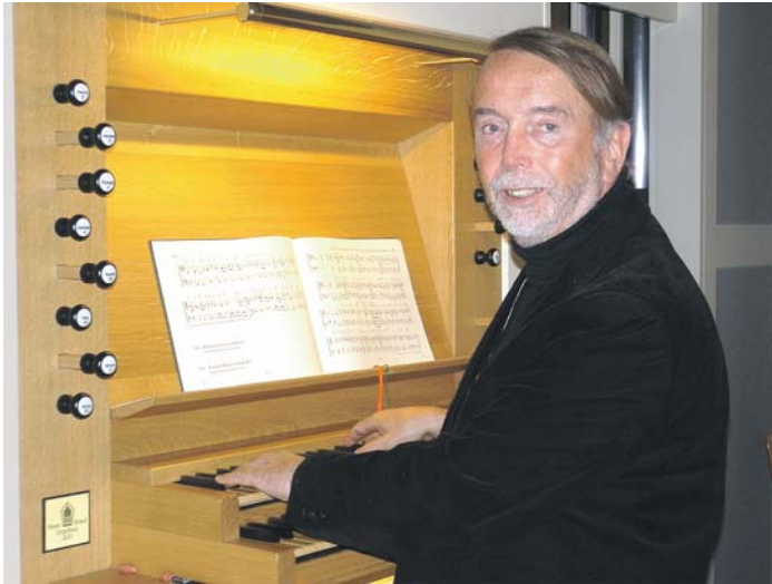
Zu »Häppchen mit Höhn« lädt die Stubengesellschaft Engen am kommenden Sonntag, 15. März, um 11.30 Uhr ins Städtische Museum Engen ein.