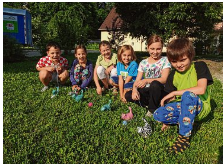
Raus in die Natur – das machte allen Spaß.

So mach Spielen sogar unter dem Schuldach Spaß!