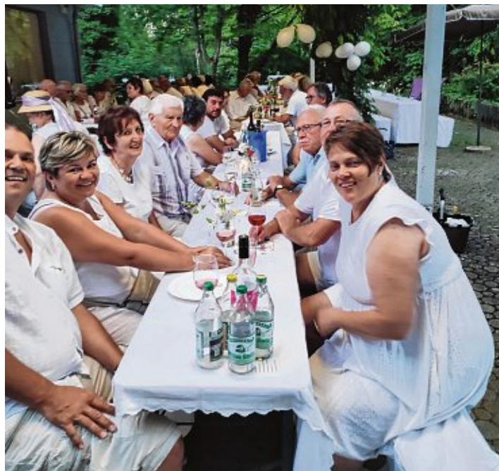
An den Erfolg des »Diner en Blanc« vom vergangenen Jahr wollen die »Senioren für Senioren« anknüpfen.

Am 12. Juli am katholischen Gemeindezentrum