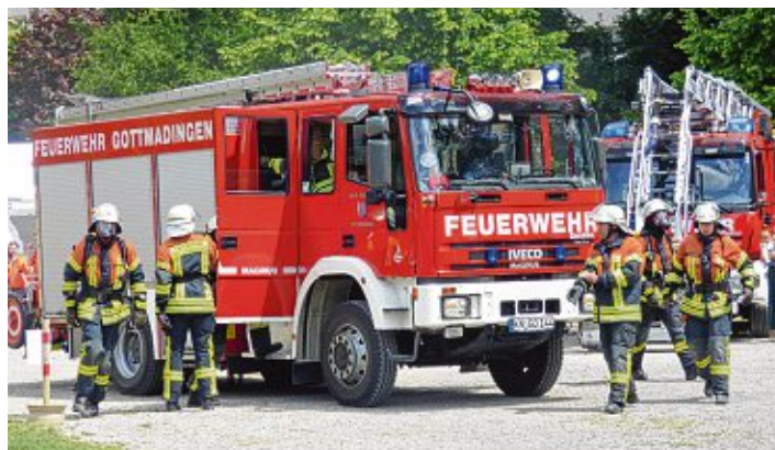
Dass die Gottmadinger Wehr weiß, was sie tut, stellt sie ständig unter Beweis. Dass sie ein Fest feiern kann, ist ebenfalls bekannt und wird demonstriert am Jubiläumswochenende vom 11. bis 13. Juli