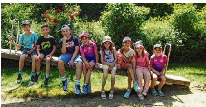
Fröhliche Gesichter auf der Wippe im Stadtgarten.