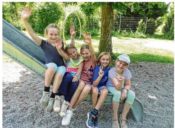
Mädels unter sich.