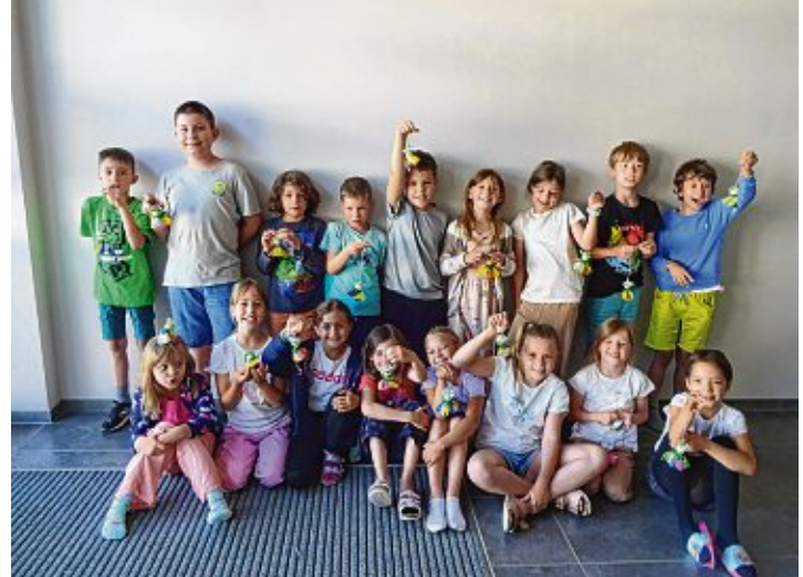
Gruppenbild mit gebastelten Elfen-Anhänger