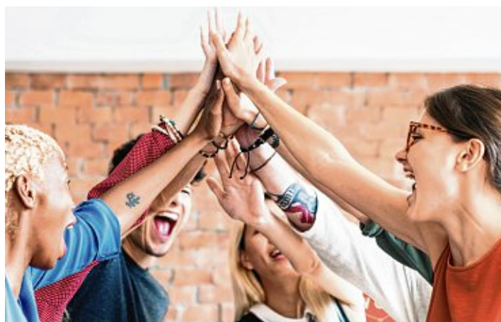
Teamwork und Austausch werden in der Pflegeschule groß geschrieben.