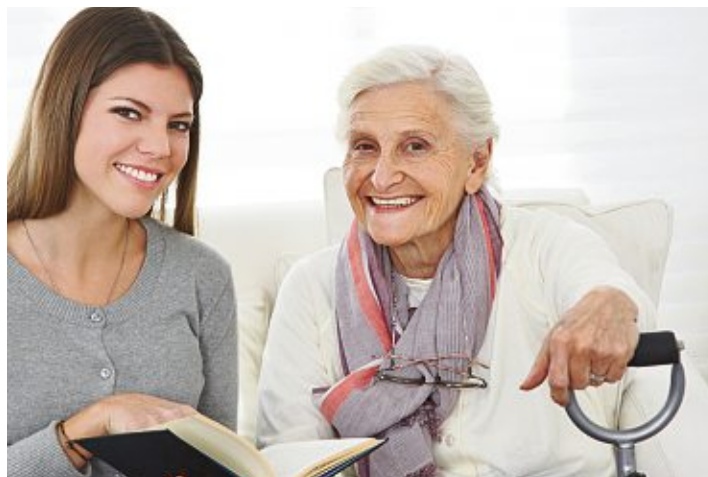
Ein Gewinn für alle Beteiligten: Ein FSJ oder BFD etwa in Schulen oder Pflegeeinrichtungen.

Weitere Informationen sowie die passende Einsatzstelle fin-