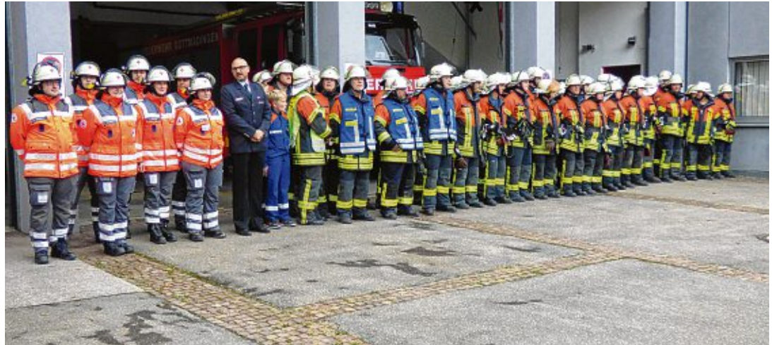
Die Gottmadinger Wehr freut sich auf den Kreisfeuerwehrtag im eigenen Ort und das Rahmenprogramm, das sie für ihr Jubiläum zusammengestellt hat.