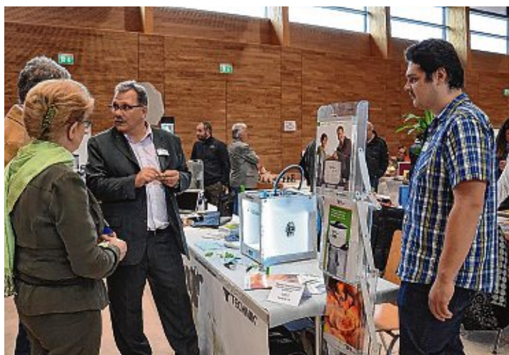
Die Tischmesse bietet wertvolle Vernetzungsmöglichkeiten für Unternehmer und Gewerbetreibende und zeigt die Vielfalt des Engener Wirtschaftslebens.