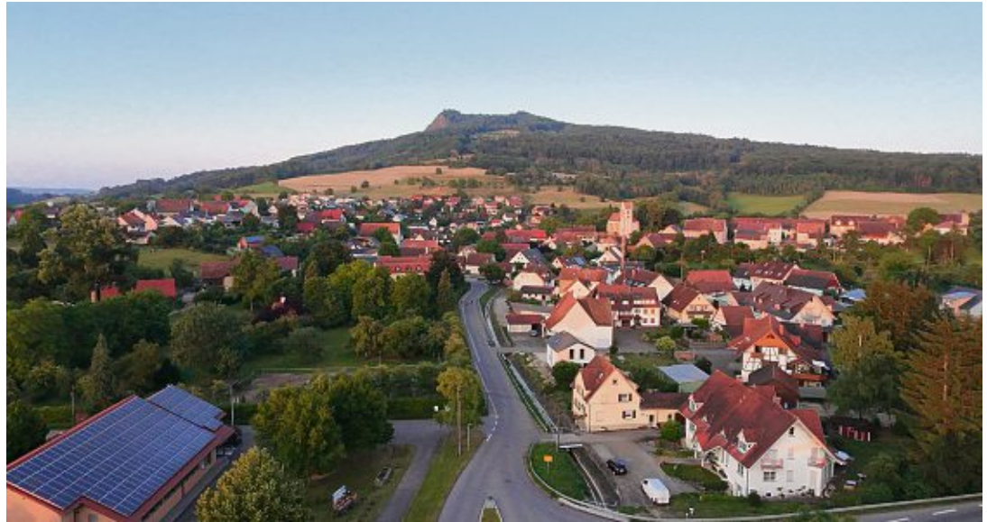
Binningen wurde im Jahr 1275 erstmals urkundlich erwähnt.

In unzähligen Terminen und Stunden wurde das Programm auf die Beine gestellt und alles Weitere für das große Festwochenende am 28. und 29. Juni vorbereitet.