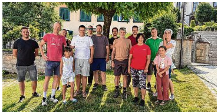
Starke Truppe: Beim Arbeitseinsatz am vergangenen Wochenende kamen die Binninger ordentlich ins Schwitzen.

Informativ wird es in der Ausstellung zur Geschichte der Kirche in Binningen in der Kirche selbst. Dort gibt es auch eine Bildershow zum alten Binningen. Am selben Ort wird am Sonntag, 9:30 Uhr, ein ökumenischer Gottesdienst gefeiert, musikalisch begleitet vom Kirchenchor Hilzingen. An der Hauptbühne gibt es im An-