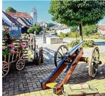
Drei Schüsse aus der Kanone eröffnen das Festwochenende.

Das Festwochenende selbst, das die erste urkundliche Erwähnung Binningens würdigt, wird am Samstag, 28. Juni, um 13:30 Uhr , mit drei Kanonenschüssen aus der Kanone von Hermann Eckstein aus Binningen offiziell eingeläutet. Damit beginnt eine Feier, die sich sehen lassen kann. Rund um das Binner Schloss und die Kirche wird ein Programm geboten, das vielfältiger nicht sein könnte. Die Hauptbühne befindet sich an der Kirche und dem Pfarrhaus, hier werden kulinarische Köstlichkeiten serviert: Neben von Leckerei-