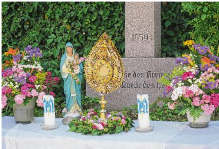
Blumengeschmückte Altäre wurden eigens vor den Kreuzen errichtet.