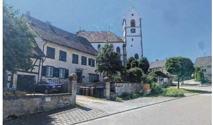
Zwischen Kirche und Schloss befindet sich die Binner Festmeile.

en vom Grill wird es auch Seeweiler Büffelgulasch mit Spätzle und Seeweiler Büffelmurci geben. Klassische alkoholische und nichtalkoholische Getränke, eine Sekt-Bar mit Apéro, eine Pils-Bar und eine Bartheke mit Longdrinks laden zum Anstoßen ein. Die Hauptbühne ist das