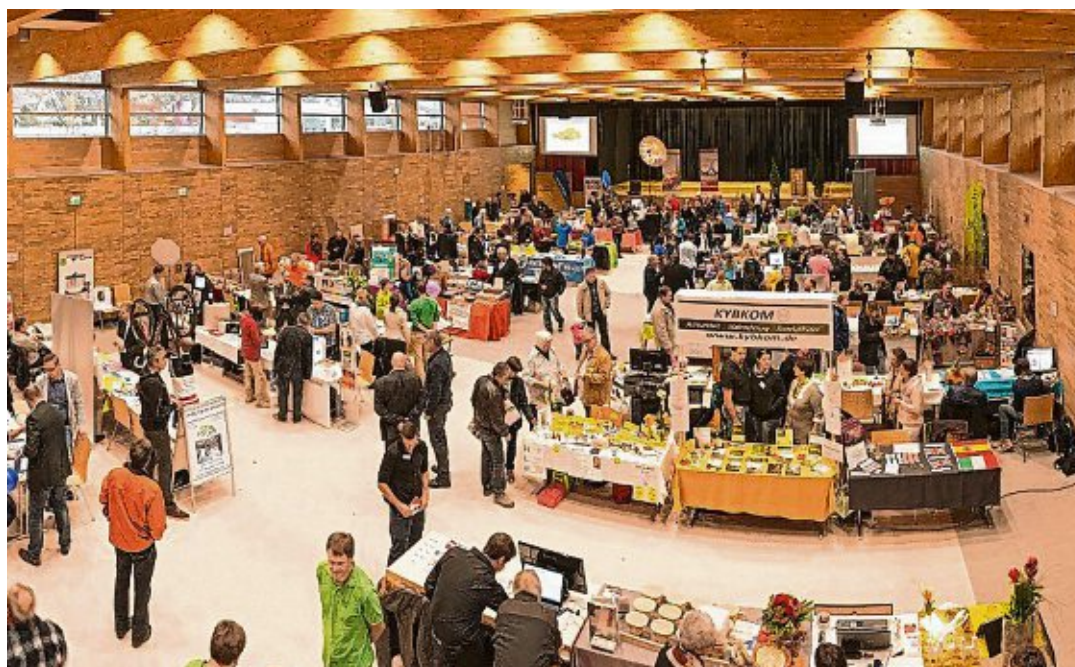
Treffpunkt der Wirtschaft: Bei der 13. Engener Info-Börse präsentieren Betriebe und Institutionen der Region ihre Produkte und Dienstleistungen.