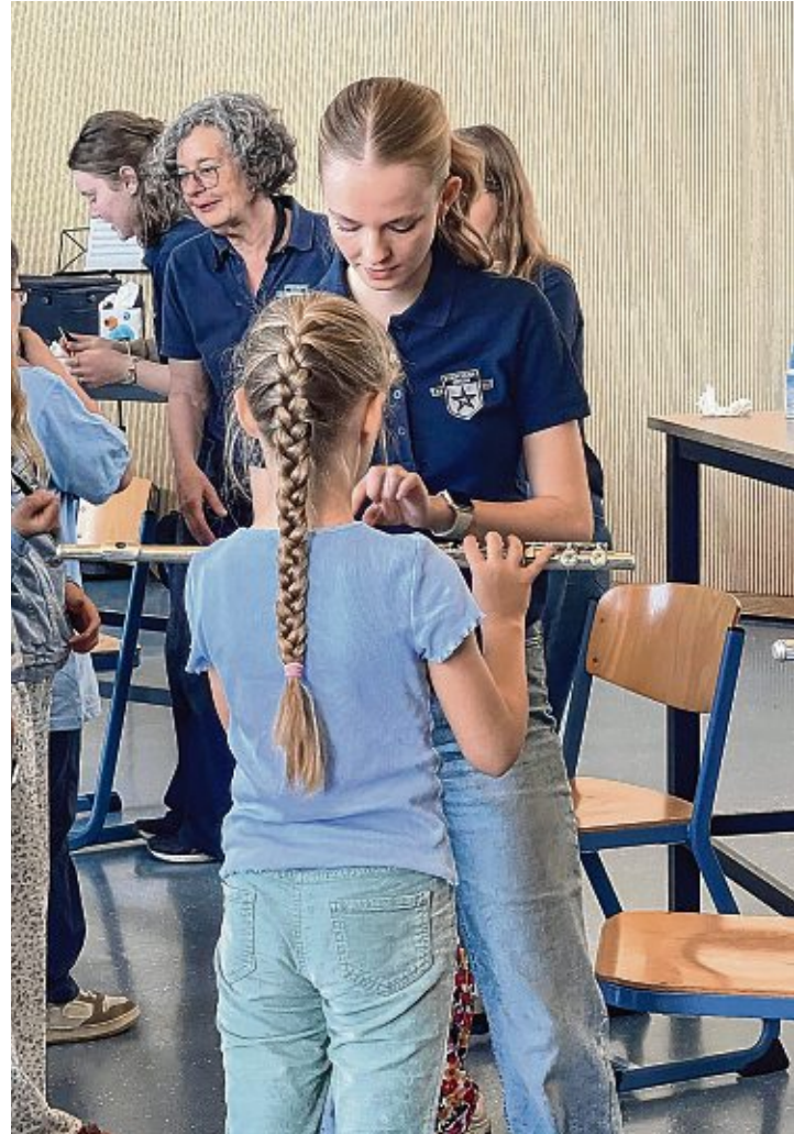
...das konnten die SchülerInnen mithilfe von erfahrenen MusikerInnen der Stadtmusik herausfinden.