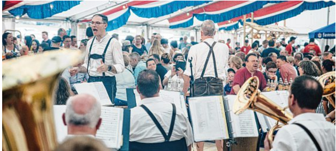
Auch im vergangenen Jahr herrschte gute Stimmung im Brunnenfest-Festzelt. Das soll sich dieses Jahr wiederholen.

Leipferdingen. Seit über 60 Jahren wird das Brunnenfest in Leipferdingen gefeiert, so auch in diesem Jahr am ersten Juliwochenende: Los geht's am Freitag, 4. Juli, um 19 Uhr mit der Musikgesellschaft Gächlingen. Die Trachtenkapelle Obermettingen spielt ab 20:45 Uhr, bevor ab 22:15 Uhr die Polyhymnia-Musikanten die Bühne übernehmen und für Stimmung sorgen. Parallel dazu öffnet ab 19 Uhr wieder die beliebte Bierpong-Arena – Spaß und Unterhaltung sind garantiert. Der Samstag steht ganz im Zeichen des Jubiläums »50 Jahre Jugendkapelle Leipferdingen«. Das Festgeschehen beginnt um 14 Uhr mit dem Musikverein Polyhymnia Leipferdingen. Anschließend folgen im Stundenrhythmus die Jugendformationen TueT Tengen, Bläserjugend Fützen, Jugendkapelle Stadtharmonie Villingen und schließlich die eigene Jugendkapelle Leipferdingen um 17:30 Uhr. Um 18:30 Uhr treffen sich alle Mitwirkenden zum Gesamtchor – ein echtes Klangerlebnis für alle Besucher. Ab 19:15 Uhr übernehmen die Randenmusikanten das musikalische Zepter, bevor ab 22 Uhr ein DJ für Partybeats sorgt.