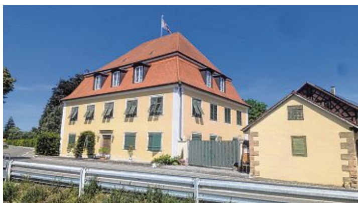
Rund um das Binninger Schloss geben Mittelaltergruppen spannende Einblicke in das Leben zur Zeit der Ortsgründung.

Der Bürgerverein hat sich extra für dieses Jubiläum gegründet: Er wird mit rund 200 Helferinnen und Helfern, die hauptsächlich aus dem Ort kommen, das Festwochenende stemmen und so für sich und alle Gäste ein unvergessliches Wochenende gestalten.