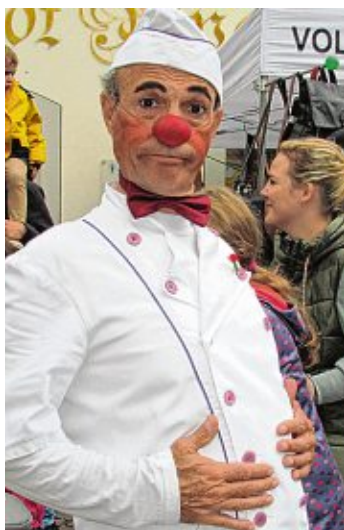
Nicht nur diesem Koch-Pantomimen scheint es geschmeckt zu haben, sondern auch die anderen Öko-markt-Besucherinnen und -Besucher genossen das vielfältige Angebot für das leibliche Wohl.