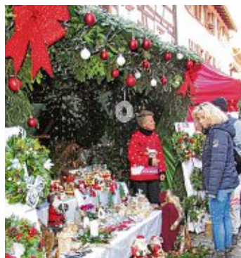
Der Weihnachtsmarkt fällt auch dieses Jahr aus.

geben, da jegliche belastbare Grundlage fehlt«, betonte die MEV-Sprecherin. Als weiteren Grund führte sie auf, dass die Kosten für Strom, Müll und anderes gerade explodieren würden. »Alle haben schon letztes Jahr über die Kosten gejammert - dieses Jahr würde es noch viel extremer werden. Im Schnitt pro Stand 90 Euro nur für Strom - eventuell mit Nachzahlungsverpflichtung«, so Berta Baum. Eine kleinere Version des Weihnachtsmarktes sei nicht kostendeckend. Zudem: Ob eine Weihnachtsbeleuchtung je möglich sein werde, sei in diesen Zeiten sehr fraglich, und auch der hohe Stromverbrauch der Stände würde sicher bei allen Energiesparprogrammen nicht gut ankommen. Auch gebe es im Augenblick keinerlei Anhaltspunkte über die Entscheidungslage. »Im Moment werben viele Städte mit ihrem »guten« Image des Sparsens: Schwäbisch Hall, Berlin, Freudenstadt, Günzburg - und es werden noch viele mehr wer-