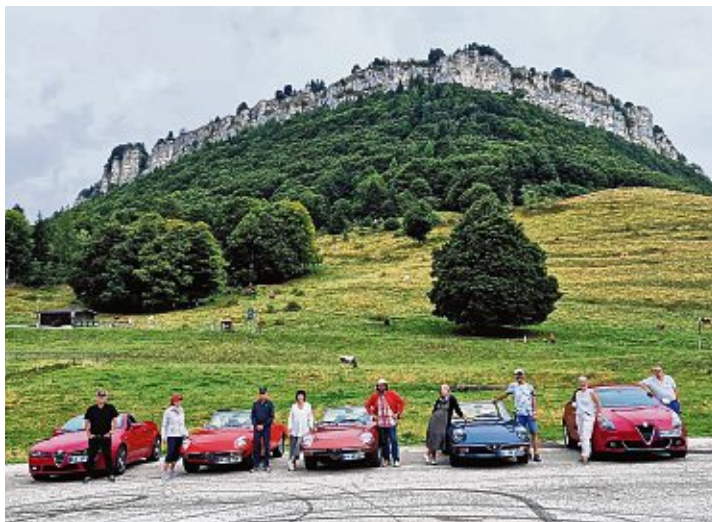
Die Jahresausfahrt des Alfaclubs Regionaltreff Bodensee führte in einer anspruchsvollen Strecke über mehrere Alpenpässe.