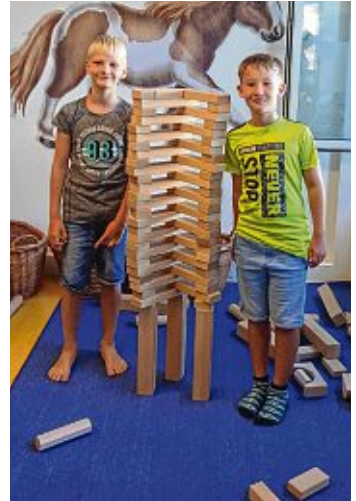
Natürlich wurden auch die Bausteine getestet und es entstanden viele verschiedene Türme.