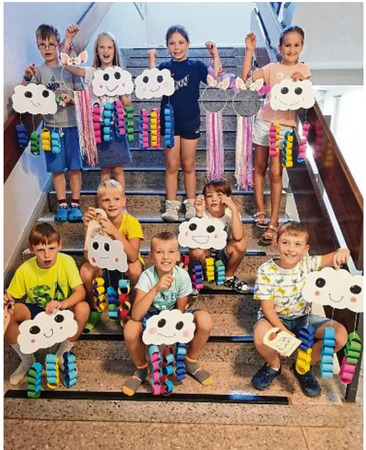
Dies sind nur drei von vielen Bastelarbeiten, die während der Ferienbetreuung gefertigt wurden.