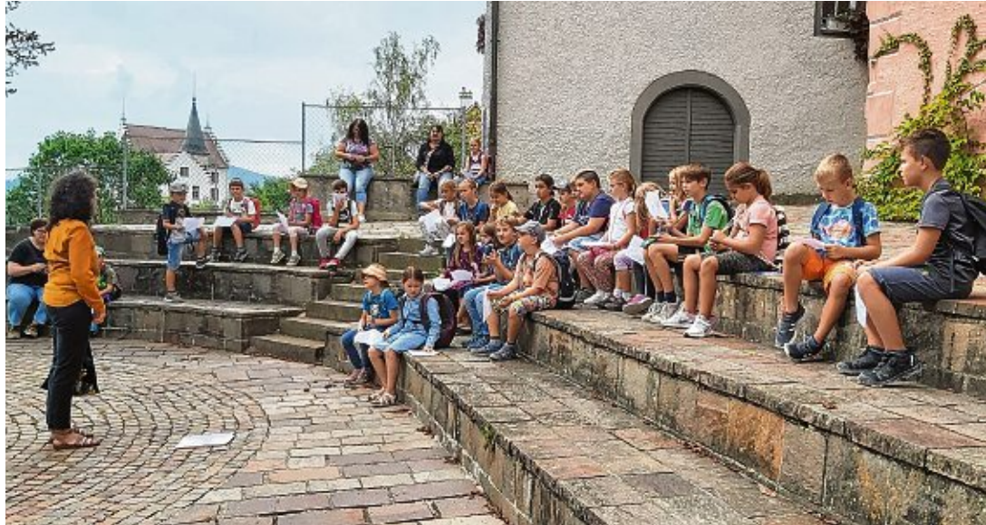
Die Kinder lernten interessante Fakten, Infos und viel Wissenswertes über ihre Heimatstadt Engen kennen.