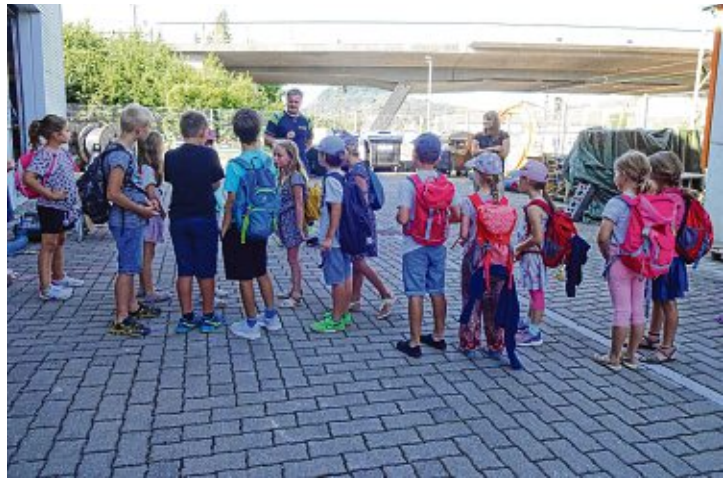
Bei den Stadtwerken erfuhren die Kinder alles über Strom, Gas, Wasser und Telekommunikation.