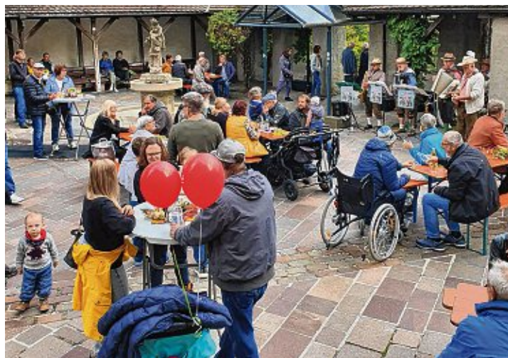
Der Touristik-Verein war mit einem schönen Stand samt Holzhaus und herbstlicher Dekoration vertreten und bot Pommes frites, Kürbissuppe und Zwiebelkuchen, Getränke und natürlich Suser an. Zur Unterhaltung spielten die »Talheimer Musikanten« auf und die Gäste, die auch gleich den neuen Kühlanhänger des Vereins bestaunen konnten, fühlten sich wohl. Das Werbemobil informierte über Engen, Ferienwohnungen und das Angebot der Stadtführungen.