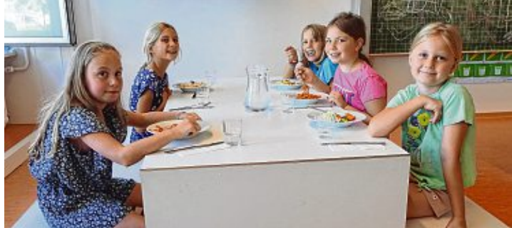
Zwischen dem Programm konnten sich die Kinder bei einem gemeinsamen Mittagessen stärken.

Es wurden tolle Windlichter mit einer speziellen Window-Color-Technik designt. Jedes Glas wurde nach der Vorstellung des Kindes selbst künstlerisch gestaltet. Dadurch wurde jedes Glas ein Unikat. Dieses durften die Kinder natürlich mit nach Hause nehmen.