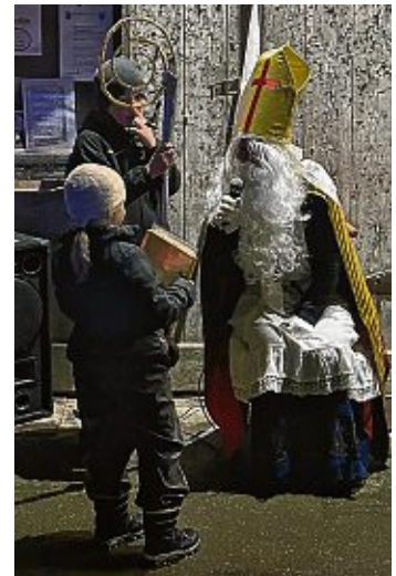
Nikolaus und Knecht Ruprecht hatten für die Kinder etwas dabei.