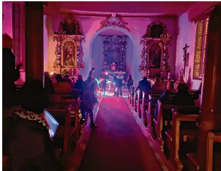
Lichterzauber präsentierte der Circus Casanietto in der Dorfkirche.