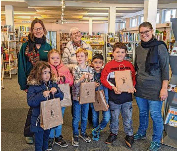
... und die SchülerInnen der Hewenschule. Die Aktion soll zur Leseförderung beitragen und gewährleisten, dass alle Kinder mindestens ein Buch zum Lesen lernen zu Hause haben. Sollten die Kinder auf den Geschmack gekommen sein, dürfen sie sich gerne kostenlos in der Stadtbibliothek weiteres Lesefutter ausleihen.