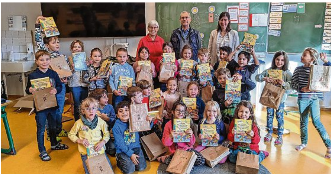
... die Elefantenklasse der Grundschule Engen...