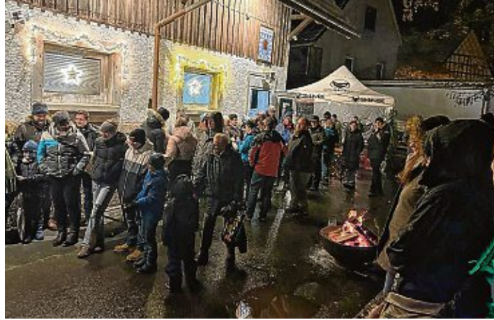
Auf dem Dorfplatz in Zimmerholz wurde zu »Weihnachten im Dorf« eingeladen.

Der Nikolaus und sein Knecht Ruprecht durften bei »Weihnachten im Dorf« nicht fehlen. Sie hatten für die Kinder etwas mitgebracht und zauberten das eine oder andere Schmunzeln in die Gesichter der Zuhörer. Bei Glühwein und Punsch war es rund um den Farrenstall ein schönes gemeinsames Einstimmen auf Weihnachten. Das Wetter ließ alle Besucher zusammenrücken und sie genossen heiße Fleischkäsewecken. Ein gelungener und spektakulärer Auftritt der Gruppe Casanietto war der Abschluss des Abends, der bei Lagerfeuer seinen Ausklang fand. Die Zimmerholzer Vereine danken allen Besuchern und den vielen Spenden für die Tombola, deren Erlös der Swimmy-Gruppe zu Gute kommt, und wünschen allen eine frohe Weihnacht.