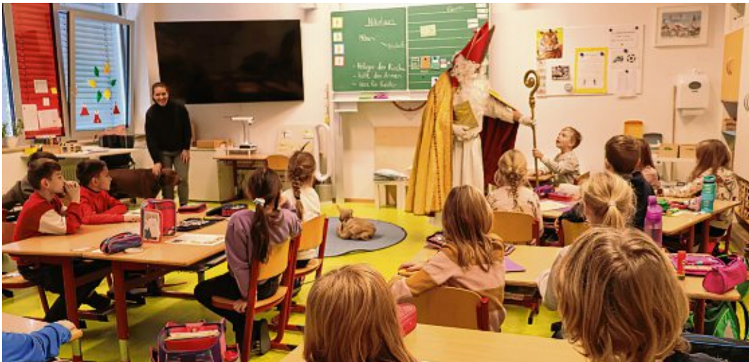
Der Nikolaus lobte die Kinder für alles, was sie schon sehr gut können ...

Hegau. Am Freitag, 15. Dezember, ist wieder Workshop ab 18.15 Uhr in der Grundschule in Mühlhausen. Interessierte dürfen gerne vorbeischaun und reinschnuppern.