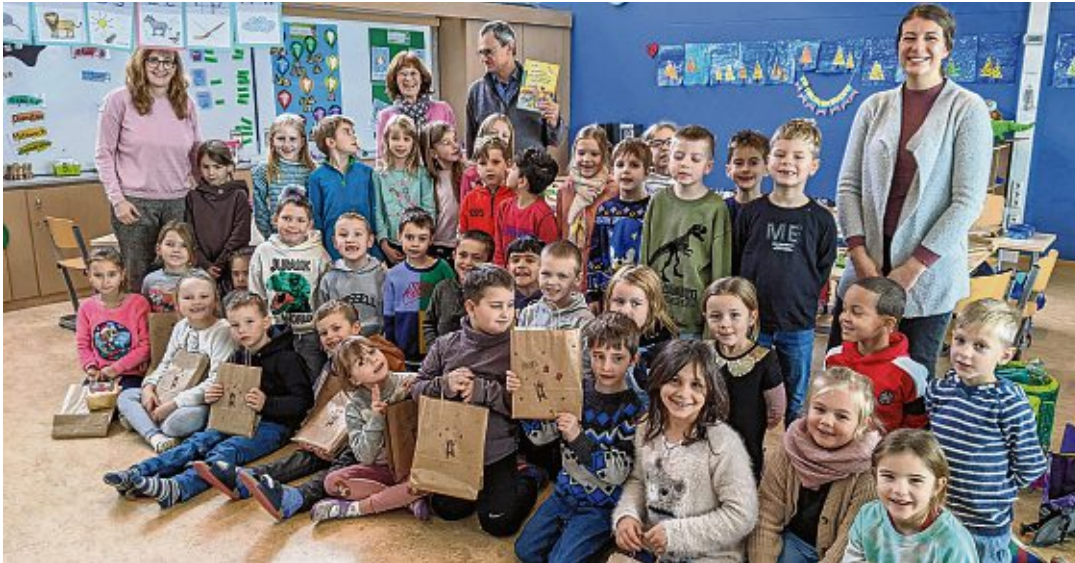
Über den Büchersegen freuten sich die Erstklässler der Grundschule Welschingen ...