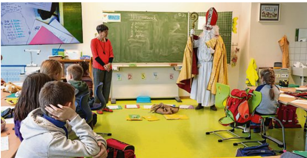
... und natürlich hatte er auch in diesem Jahr wieder ein gut gefülltes Säckchen für die braven Schülerinnen und Schüler dabei.