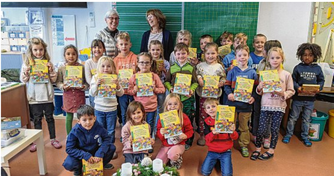
... die Eisbärenklasse der Grundschule Mühlhausen-Ehingen ...