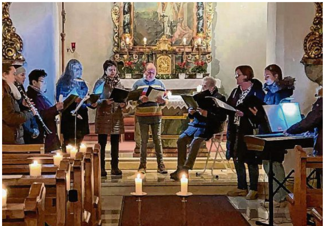
Das »Chörle« stimmte bei Kerzenschein in der Sankt Ulrichskirche alle Besucher auf Weihnachten ein.