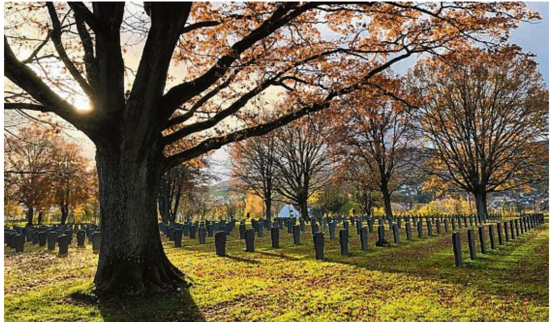
Der Soldatenfriedhof bei Niederbronn-les-Bains wurde ebenso besucht...

Der nächste Morgen begann mit der Reise nach Natzweiler-Struthof. Hier wurde die Stufe in die zwei Geschichtskurse aufgeteilt. Die erste Gruppe begann mit einer Führung durch das gesamte Konzentrationsla-