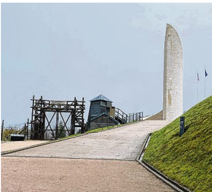
...wie das ehemalige Konzentrationslager Natzweiler-Struthof

Die Fahrt wurde finanziell unterstützt von einem Bildungspartner des Gymnasiums Engen, dem Volksbund Deutsche Kriegsgräberfürsorge.