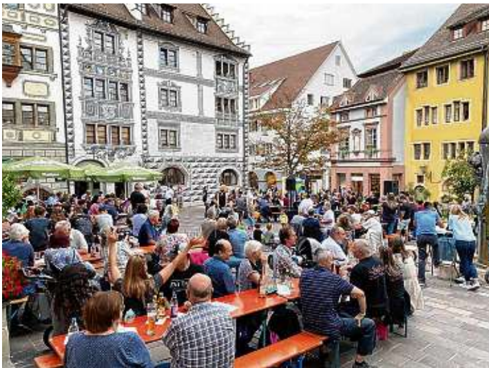
Die Altstadt war bei der zweiten Auflage des »Late Night Shoppings« belebt wie schon lange nicht mehr.

Den fackelnden Abschluss gestaltete der Circus Casanietto mit seiner sagenhaften Lichtershow, die alle Anwesenden begeisterte.