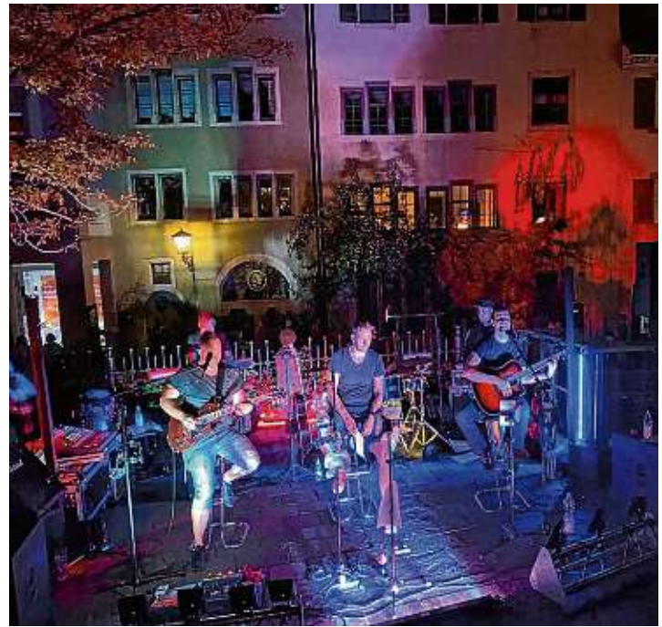
Die Engener Rockband »Schlaflos« sorgte auf dem Marktplatz beim zweiten »Late Night Shopping« für tolle Stimmung bei den Besucherinnen und Besuchern.