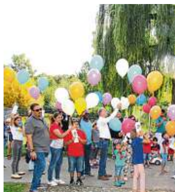
Auf das Steigenlassen von Luftballons, wie auf dem Foto im vergangenen Jahr, wird dieses Mal aus Rücksicht auf die Natur verzichtet.