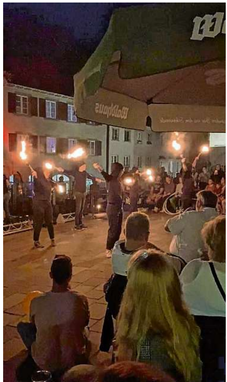
Mit einer mitreißenden Lichtershow gestaltete der Circus Casanietto den Abschluss des gelungenen und gut besuchten »Late Night Shoppings«.