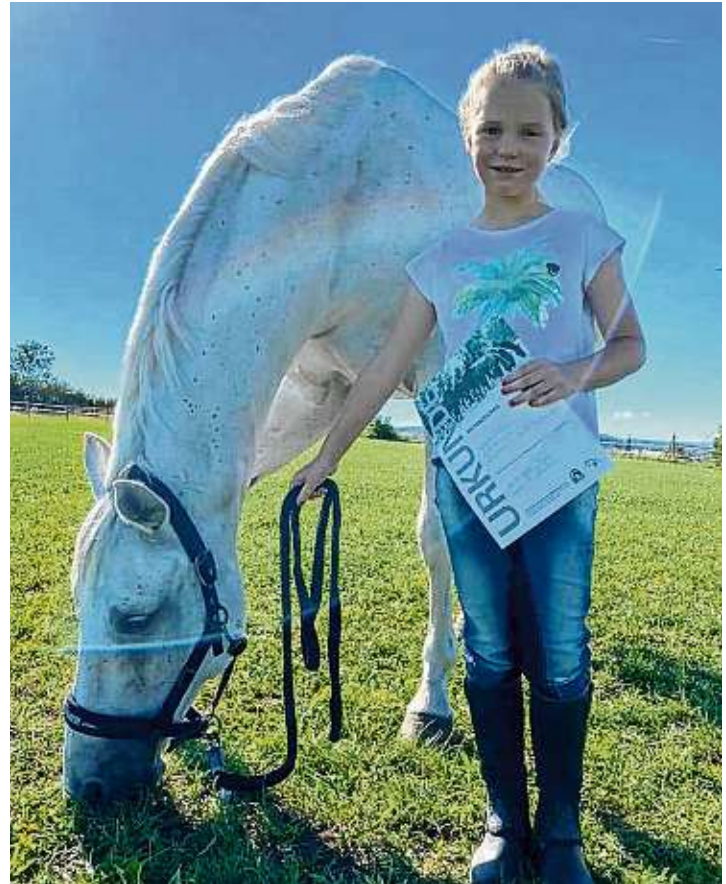
Eine Prüfung stand am Ende des Lehrgangs, den der Reitclub Schoren-Engen in den Sommerferien zum ersten Mal zum Erwerb des Pferdeführerscheins angeboten hat.

Nach erfolgreich abgeschlossener Prüfung waren sich alle Teilnehmer einig, dass doch jeder noch etwas Neues lernen konnte und dass alle auch unter Einhaltung der Corona-Regeln jede Menge Spaß hatten.