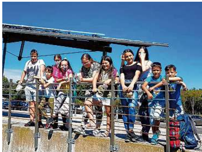
Zum bunten Ferienspaß der Kinderwohnung Kunterbunt zählten auch mehrere Ausflüge.

selbstgebastelten Wasserbomben gab. Darüber hinaus gab es viele großartige kreative Angebote. Es wurden T-Shirts gebastelt, Fensterdekorationen mit Window Color gestaltet und Windlichter und Grußkarten mit Serviettentechnik verziert. Außerdem gab es ein Projekt zum Thema Freundschaft. Gemeinsam schauten sich alle verschiedene Bücher an, in denen unterschiedliche Aspekte von Freundschaft thematisiert wurden, und gingen folgenden Fragen auf den Grund: Warum sind Freunde wichtig? Was machen Freunde alles gemeinsam? Woran erkennt man einen echten Freund? Hierzu gestalteten die Kinder ein MindMap und spielten verschiedene Spiele. Zum Abschluss überlegten sie gemeinsam, wie man Freundschaft kreativ darstellen kann, und gestalteten mit ihren Ideen zusammen ein riesiges Bild, das demnächst in der Flur der Kinderwohnung Kunterbunt aufgehängt wird.