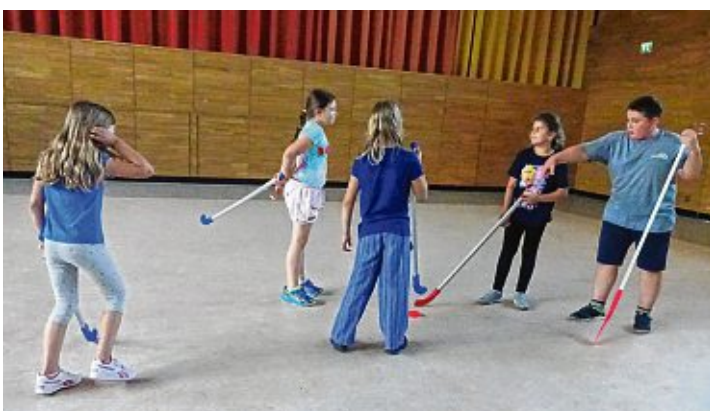
Spiel, Spaß und Bewegung gab es in der Turnhalle.