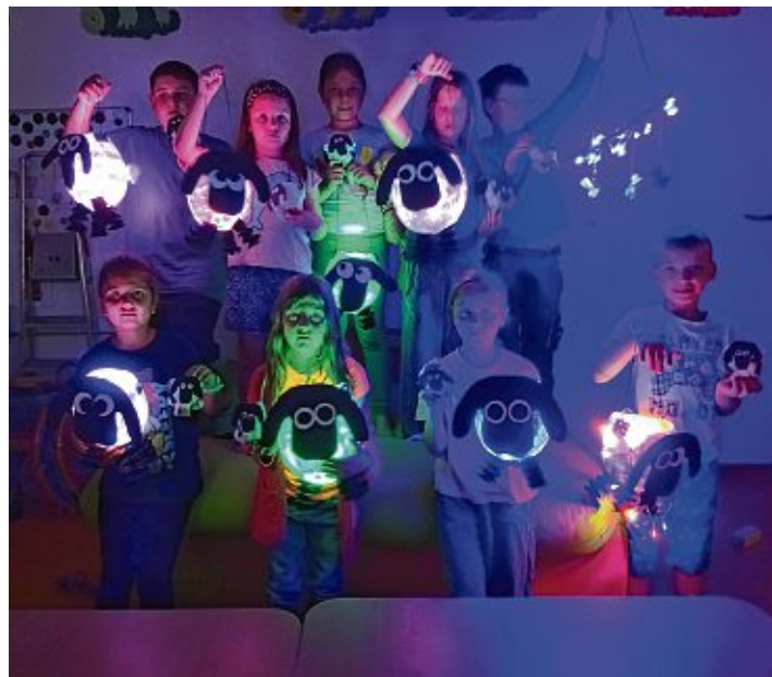
Die »Shun das Schaf-Laternen« mussten nach Fertigstellung auch gleich im abgedunkelten Zimmer ausprobiert werden.