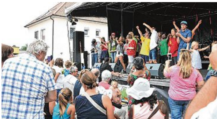
Das letzte Mal fand »Sound am Bach« im Sommer 2019 statt.

Weitere Informationen unter: www.haus-am-muehlebach.de .