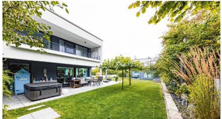
Homeoffice ist auch im Garten möglich - allerdings gibt es manches zu beachten.

„Wer uns nicht kennt, hat die Fliesenwelt verpennt.“