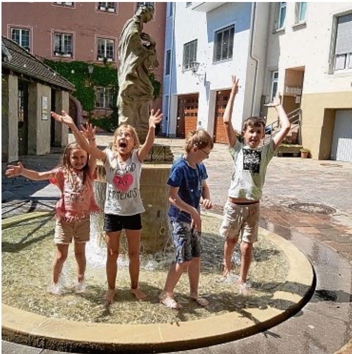
Der sommerlichen Hitze konnte eine Wasserschlacht am Marienbrunnen Abhilfe schaffen.