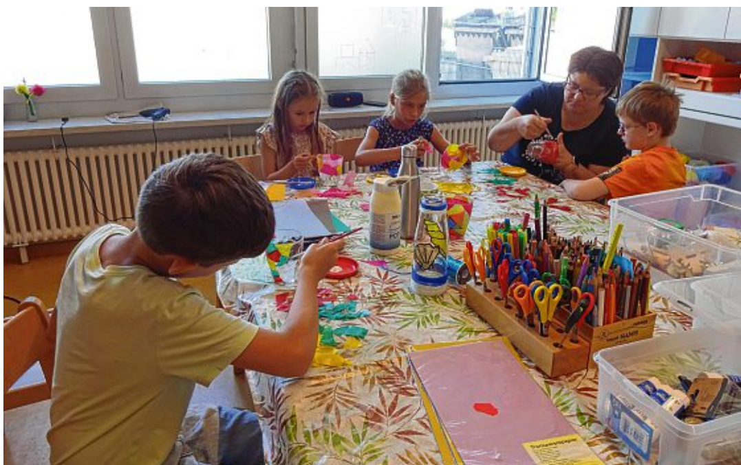
Ganz konzentriert bemalten und beklebten die Kinder Gläser und designten so ihr eigenes Teelicht.

Etwas ruhiger ging es am letzten Tag zu. Die selbst gemachten Gipsfiguren wurden noch bemalt und es wurde der Film »Planet Erde« als Dokumentarfilm für Kinder angeschaut. Zum Abschluss der Ferienbetreuung gab es für jeden ein Eis in der Stadt.