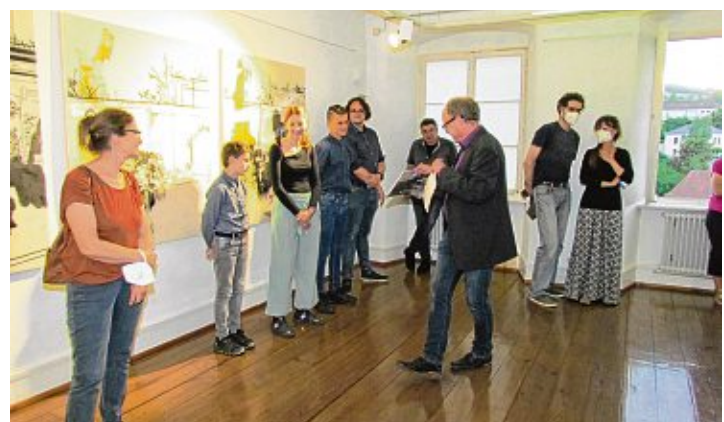
Da das von 1949 bis 2001 gültige 50-Pfennig-Stück der jungen Generation nicht mehr vertraut ist, zeigte Clemens Ottnad im Rahmen seiner Laudatio Abbildungen der Münze, auf deren Bildseite eine »Baumpflanzerin« zu sehen war.