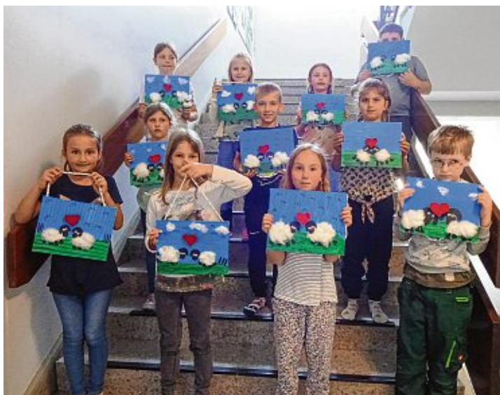
Die Leinwände zum Projekt »Shun das Schaf« wurden stolz präsentiert. Jedes Kind konnte seine eigene Leinwand gestalten.