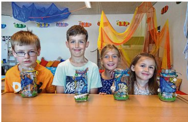
Sichtlich stolz präsentierten die Kinder die selbst gestalteten Vasen im maritimen Look.