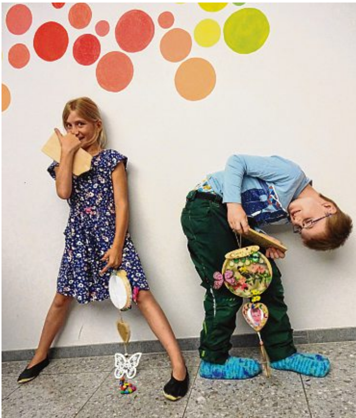
Mit dem aus Serviettentechnik gemachten Fensterbild mit Mobileanhänger wurde ein lustiges Fotoshooting gemacht.