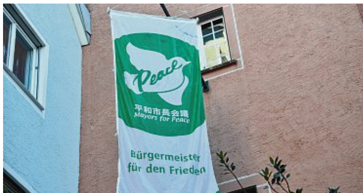
Die Stadt Engen zeigt Flagge für den Frieden und gegen Atomwaffen.