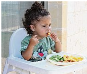
BeKi gibt Tipps für kleine Lecker-mäulchen.

Im Rahmen der Landesinitiative Bewusste Kinderernährung (Beki) bietet das »Forum Ernährung und Verbraucherbildung« am Landwirtschaftsamt in Stockach in Kooperation mit der Volkshochschule kostenlose Online-Kurse zur Ernährung von Babys und Kleinkindern an.