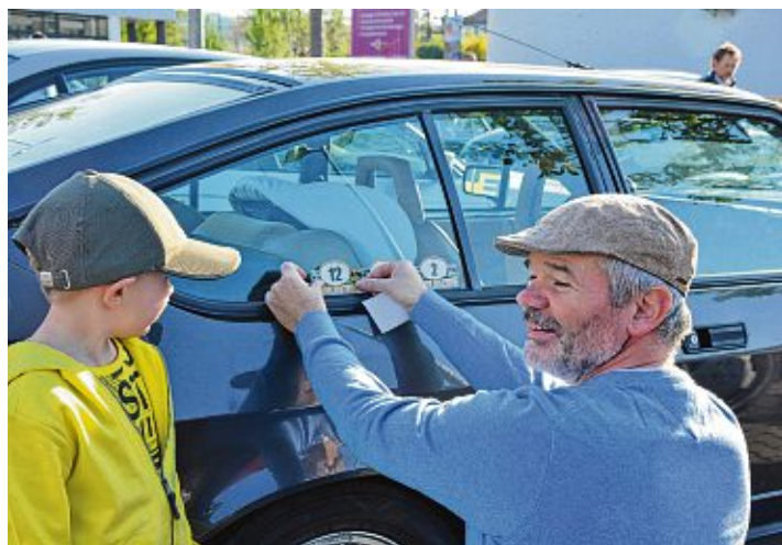
Die Oldtimer-Rallye »Hegau Historic« bietet viel Spaß für Klein und Groß.

Engen. Die Organisatoren der Veranstaltung vom »Oldtimer und Fahrzeug Museum Engen« freuen sich, wieder einmal die verschiedensten Fahrzeuge aus fast 70 Jahren Automobilgeschichte willkommen heißen zu dürfen: Das älteste gemeldete Fahrzeug ist ein VW Käfer aus dem Jahr 1957, das jüngste Fahrzeug stammt aus 1993. »Besonders freuen wir uns über die bunte Mischung bei den Teilnehmenden und ihren Fahrzeugen: Wir haben Oldtimer-Rallye-Neulinge genauso am Start wie Profi-Rallye-TeilnehmerInnen – und wir sind sicher, dass alle auf ihre Kosten kom-