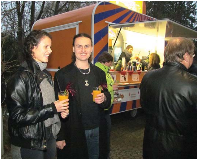
Mit alkoholfreien Cocktails vom »b.free«-Saftladen wurde bei der offiziellen Einweihung auf den neuen Jugendtreff im Hexenwegle 2 angestoßen.