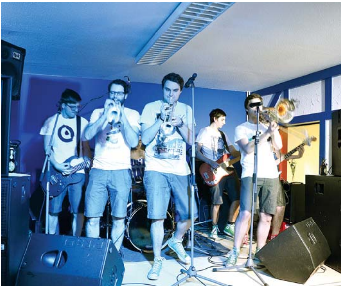
Ein Live-Konzert mit der Ska Punk Band »Horny Lulu« setzte den fetzigen Schlusspunkt an die offizielle Einweihung des neuen Jugendtreffs im Hexenwegle 2.