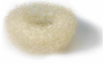
Artischockenschale, 50 x 20 Zentimeter, 2012.

Passend zur Jahreszeit zeigt die in Hausen ob Rottweil lebende Künstlerin Angela M. Flaig in ihrer Ausstellung Objekte und Bilder, deren organisches Ausgangsmaterial aus dem Zyklus der Natur herausgelöst wurde und in skulpturaler Form nicht als Frühlingsboten in der Natur, sondern als Kunstwerke im Museum begegnen.