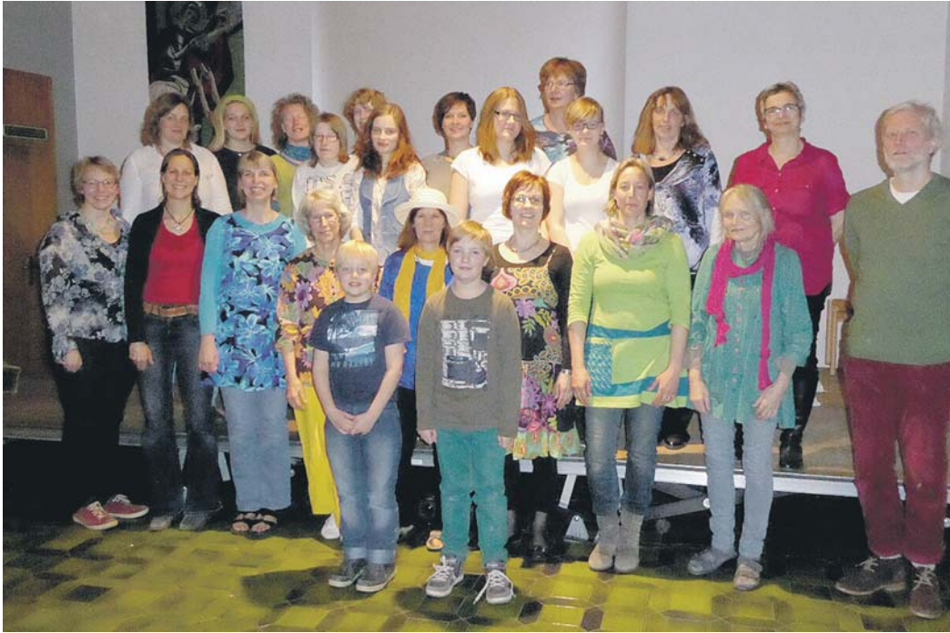
Die Mitwirkenden am Einstimmungsnachmittag und am Gottesdienst zum Weltgebetstag 2015 auf einen Blick.