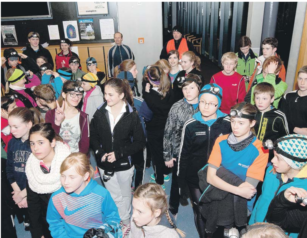
Beim Stirnlampenlauf des Gymnasiums Engen wurde in diesem Jahr erstmals die Teilnehmerzahl 70 geknackt. Sponsor der Stirnlampen war erneut die Stadtwerke Engen GmbH.

Weitere Infos unter www.oldschoolband.de .