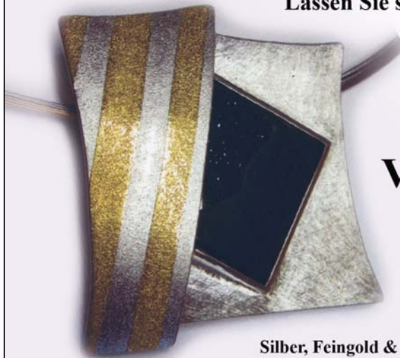
Silber, Feingold & Onyxrasen