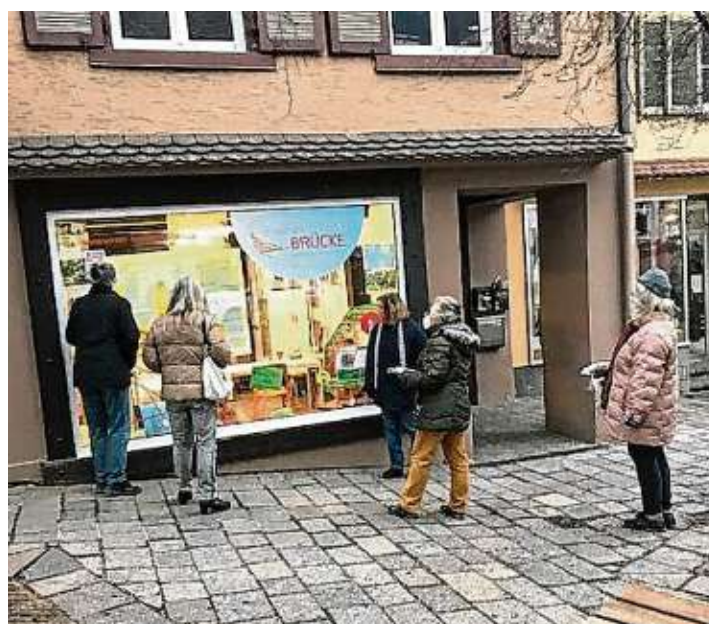
Um den Klimawandel, von dessen Folgen Vanuatu weltweit am meisten bedroht ist, ging es bei der fünften Station.