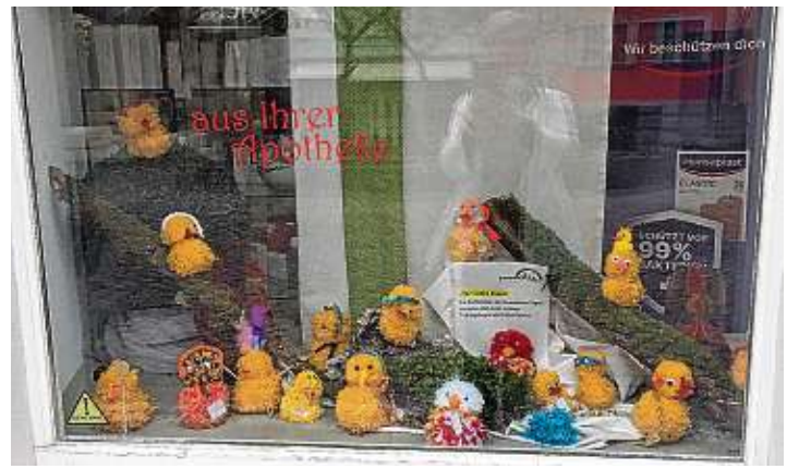
Die Erstklässler der Grundschule Engen haben während der Fernlernzeit nicht nur fleißig an ihren Mathematik- und Deutschaufgaben gearbeitet, sondern auch Kunst und Werken stand auf den Arbeitsplänen. Dabei sind diese »verrückten Küken« entstanden. Um möglichst vielen Menschen mit den tollen Ergebnissen eine Freude zu bereiten, sind sie nun in den Schaufenstern der örtlichen Apotheken zu finden. Die Grundschule Engen wünscht allen eine frohe Osterzeit.