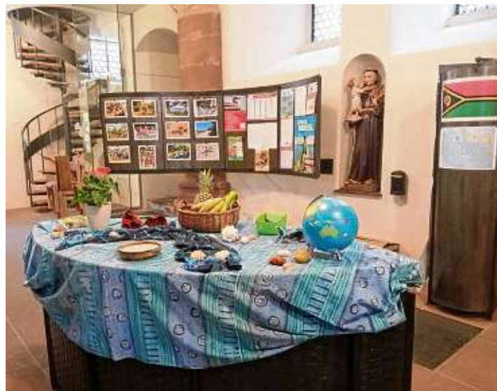
An der ersten Station gab es Interessantes über Vanuatu zu erfahren.

Die letzte Station lud zu Andacht und Segen ein. Eine Kerze in Gedenken an die Menschen in Vanuatu und ihre Herausforderungen konnte entzündet und ein Beitrag zur Kollekte gegeben werden. Das Team in Engen bedankt sich herzlich für die großzügigen Gaben, die an die Weltgebetstagsbewegung gespendet wurden. Mit einem Segen zu einem Lebensgarten in Fülle wurden die BesucherInnen an dieser Station verabschiedet. Viele nutzten die Gelegenheit, bei Live-Musik und Solo-Gesang der Lieder des WGT 2021 noch in der Stadtkirche zu verweilen.