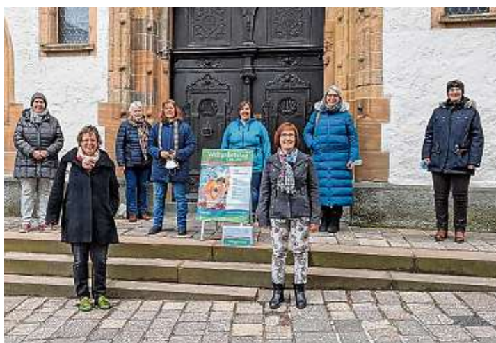
Das Weltgebetstagsteam in Engen.