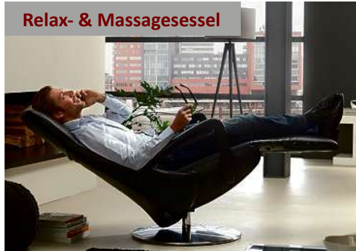
Relax- & Massagesessel

TESTEN SIE UNSERE RÜCKENFREUNDLICHEN MASSAGE- UND RELAXSESSEL, FUNKTIONSSOFAS, ARBEITSSTÜHLE FÜR'S HOME-OFFICE UND DAS WELLNESS-BETTSYSTEM. IHR WOHLBEFINDEN IST UNSER ANLIEGEN!