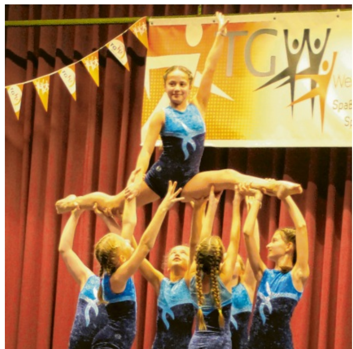
„Die Großen Kleinen“ der SGW-14 Gruppe zeigten, was sich mit Power, Präzision, Kraft und jeder Menge Disziplin erreichen lässt.