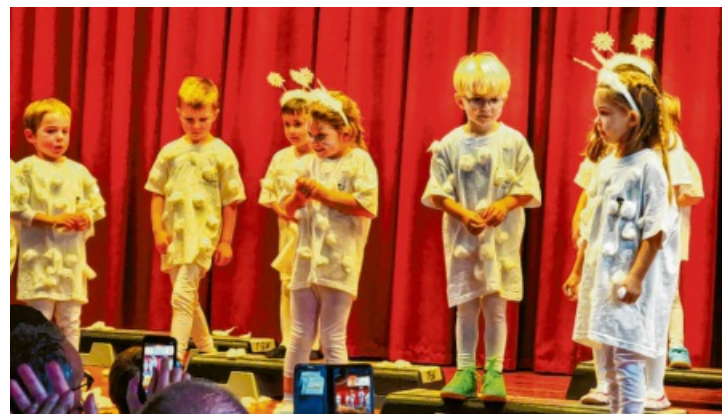
Als „Schneeflocken“ verzauberten die Vorschulkinder ab viereinhalb Jahren die ZuschauerInnen.