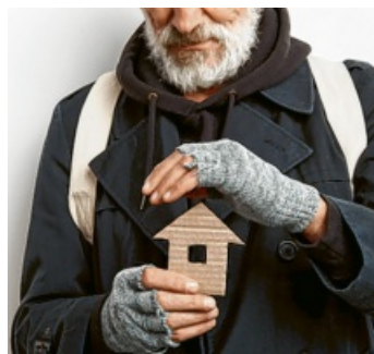
Die Stadt möchte für Obdachlose in Not sensibilisieren.

Die Stadt Engen bedankt sich bei allen Bürgerinnen und Bürgern für deren Unterstützung.