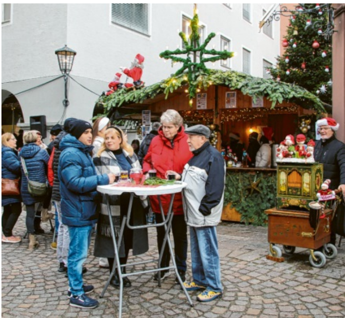
Leierkasten, Lebkuchen und Glühwein: Die Besucherinnen und Besucher genossen bei heißen Getränken und Musik das Flair der Altstadt.