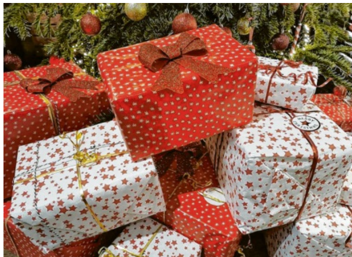
Jedes Jahr stellt sich die Frage: Was kommt unter den Weihnachtsbaum.

Umgekehrt verhält es sich mit einem nagelneuen und schicken Smartphone: Nur 10 Prozent wollen eines verschenken, aber bei rund einem Viertel mehr steht es auf der Wunschliste ganz oben (knapp 13 Prozent).