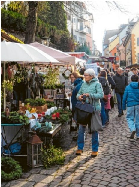
Sogar einige Wintersonnenstrahlen konnten die Besucher am Samstag genießen.