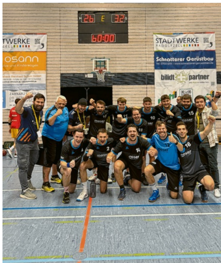
Die Handball-Mannschaft des TV Engen

Nun heißt es, weitere Abläufe zu optimieren und die Leistung über volle 60 Minuten abzurufen.