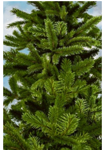
Der natürliche Baum ist immer noch die naturfreundlichere Wahl.

Zwar wird oft argumentiert, ein Plastikbaum sei durch seine Wiederverwendbarkeit nachhaltiger – doch das ist ein Mythos: Ein Kunststoffbaum müsste mindestens 17 bis 20 Jahre genutzt werden, um ökologisch mit einem Naturbaum gleichzuziehen.