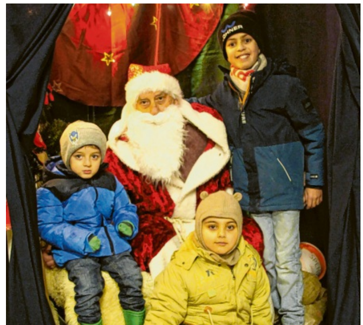
„Santa's Grotto“ - in der Begegnungsstätte „Engener Brücke“ konnten die Kinder ihre Wünsche loswerden und ein Foto mit Santa machen.