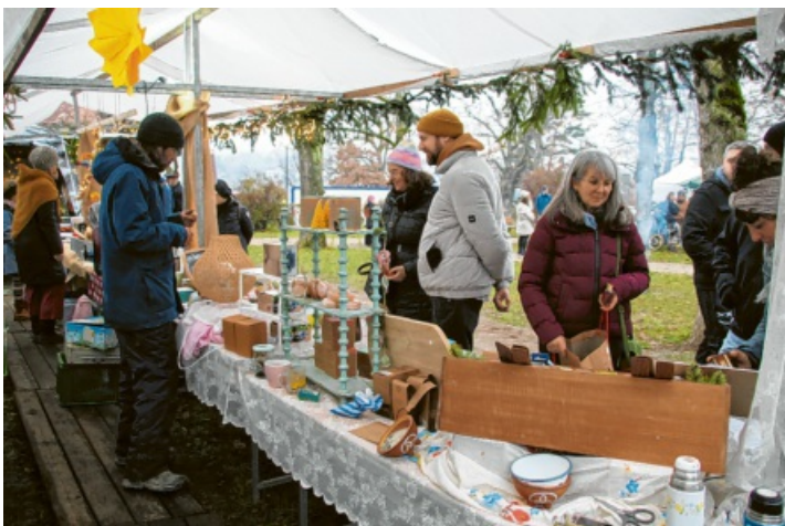
Tagsüber gab es schöne Dinge - nachhaltig hergestellt - auf dem „alternativen Weihnachtsmarkt“ im Alten Stadtgarten...