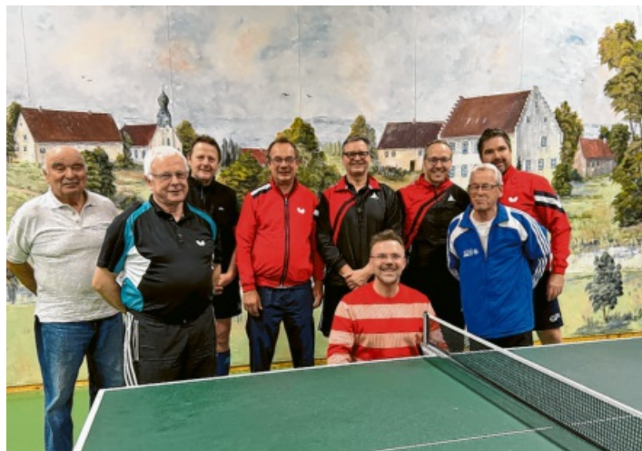
Die strahlenden Vereinsmeister.