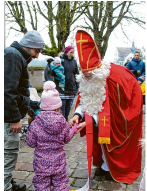
Der Nikolaus erfreute die Kinder, die dafür zahlreich auf die Freilichtbühne gekommen waren.