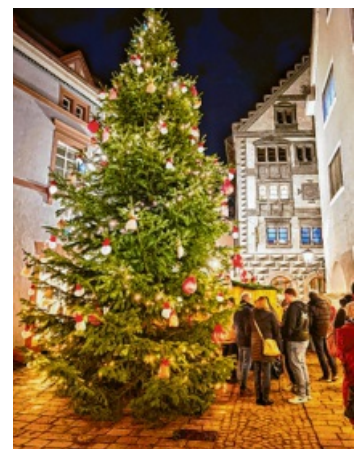
Von den „Swimmys“ geschmückt erstrahlt der Weihnachtsbaum vor dem Rathaus.