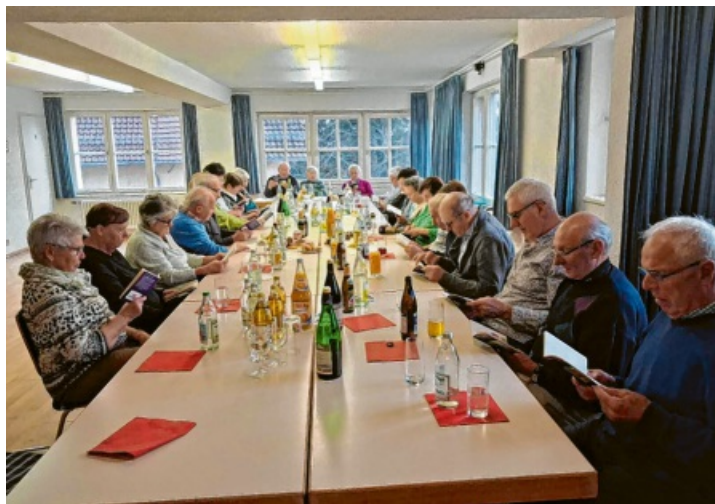
Gemütlich war es beim Treff der DRK Senioren Stetten/Zimmerholz, zu dem man sich gemeinsam eingefunden hatte.

Gemütliches Beisammensein: Stettener, Zimmerholzer und Welschinger freuten sich über Unterhaltung und gemeinsames Essen