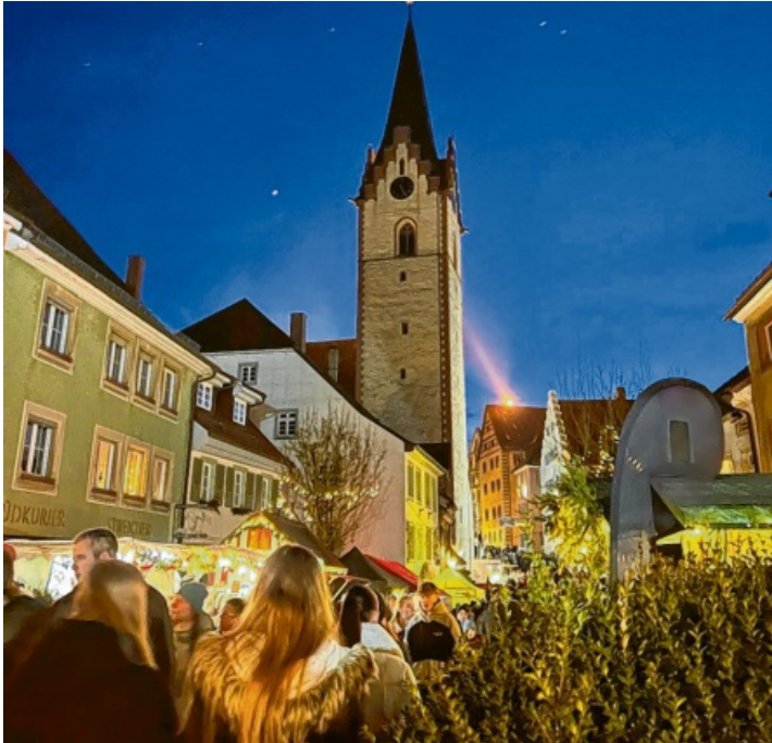
Am Samstagabend zogen Lichter und Leckerein viel Publikum von nah und fern an.