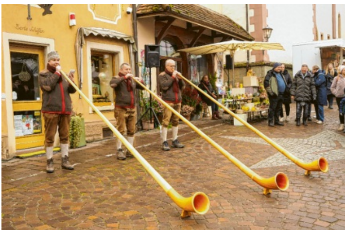
Das Bodensee-Alphorntrio (Bild) sorgte für Bergweihnachtsstimmung in der Altstadt, ebenso wie die „Hegauer Alphörner“.