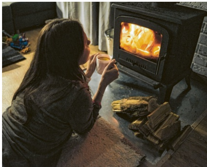
Die Wärme eines Holzofens sorgt für Entspannung und Gemütlichkeit.

Kein Wunder also, dass Kaminöfen bei Bauherren und Mietern ganz weit oben auf der Wunschliste stehen. Und das Feuerholz machen mit der passenden Ausrüstung macht ebenfalls Spaß.