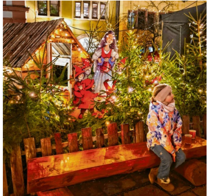
Auch die Kleinen fühlten sich wohl und genossen die schöne Stimmung, für die auch die hübsch illuminierten Märchenstationen sorgten.