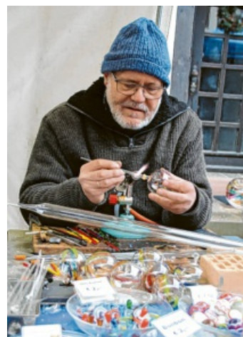
Der Glasbläser zeigte, wie seine fragilen Kleinode entstehen.