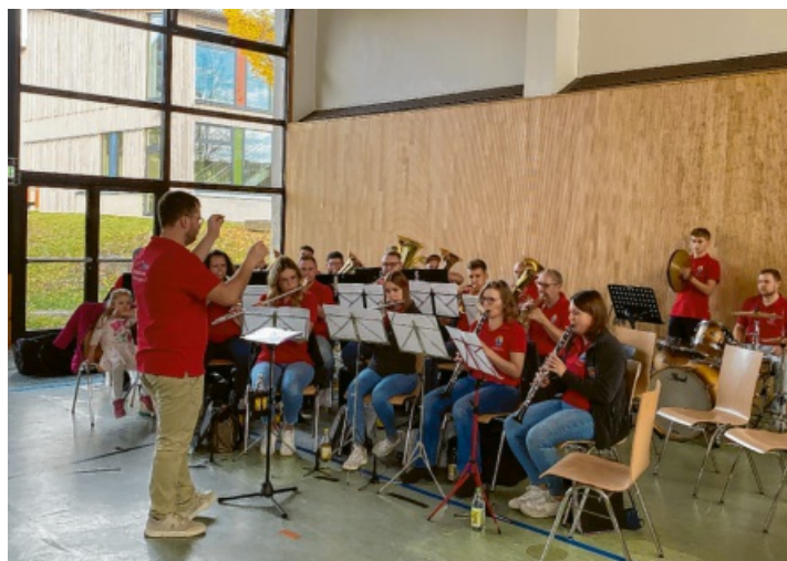
Musikalische Unterhaltung vom MV Welschingen gab es in der Hohenhewenhalle.

„Wir freuen uns auf die Seniorennachmittage im November 2026 und hoffen, wieder viele Gäste in allen Ortsteilen herzlich begrüßen zu können“, lässt der DRK-Ortsverein Engen wissen.