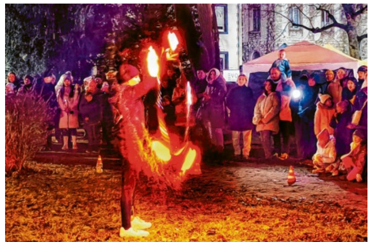
... abends sorgten die „Casaniettos“ für eine tolle Stimmung, ebenso wie Sing-alongs rund um den Feuerkorb.