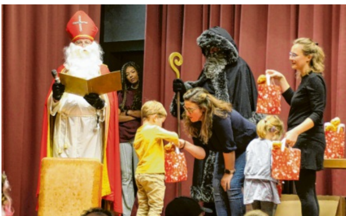
Heiß ersehnt, lang erwartet: Am Ende des spannenden sportlichen Nachmittags kam der Nikolaus mit seinen guten Gaben zu den Kindern.