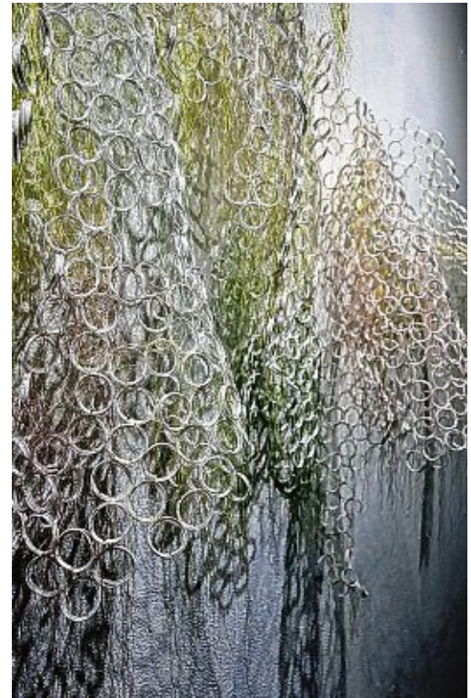
Plastic Planet 02.