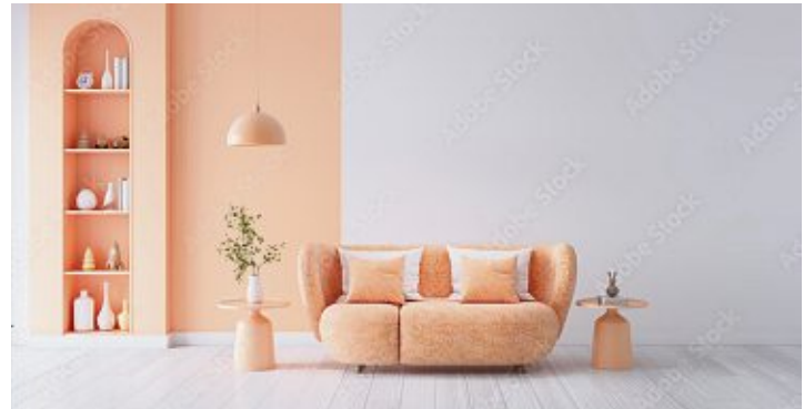
Ob als Wandfarbe oder Mobiliar: »Peach Fuzz« ist die Trendfarbe 2024.

Und wer auf Accessoires setzt, sollte diese auf jeden Fall in ungerader Anzahl verwenden. Das wirkt harmonischer. Gewählte Lieblingsstücke lassen sich auf diese Weise gekonnt inszenieren.