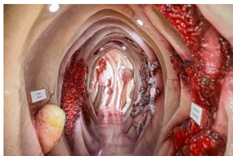
– Darm von Innen – © www.organmodelle.de

Am Klinikum Singen laden vor dem Hauptgebäude vier überlebensgroße Organmodelle (Darm, Herz, Kopf, Wirbelsäule) zu einem span-