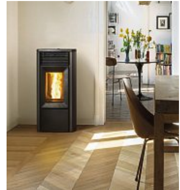
Biomasseheizungen wie wasserführende Pelletöfen werden in Bestandsgebäuden gefördert.

ten Emissionsminderungs-Zuschlag) von 2.500 Euro erhalten, wenn sie weniger als 2,5 mg/m 3 Staub emittieren. Diese Geräte sind mit einem Staubabscheider ausgestattet. Eigentümer mit einem zu versteuernden Haushaltsjahreseinkommen von bis zu insgesamt 40.000 Euro erhalten einen zusätzlichen Einkommensbonus von 30 Prozent. Weitere Informationen unter www.kfw.de und www.ratgeber-öfen.de