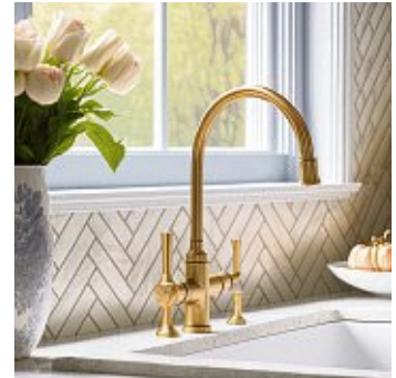
Im Trend: Armaturen in Gold oder Kupfer.

Die Möglichkeiten sind herrlich vielfältig und reichen von betont natürlichen Grüntönen über dunkles Anthrazit bis zu fast schon dramatischen Rot-, Orange- und Aubergine-Nuancen. In einem sind sich alle Farben jedoch einig: Bitte matt. Die Zeit der hochglänzenden Fronten ist vorerst vorbei – zum