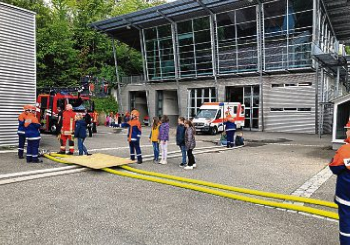
Die vierten Klassen der Grundschulen Engen und Welschingen erlebten tolle Aktionen bei der Feuerwehr.

Engen. Feuerwehrleute der freiwilligen Feuerwehr in Engen, die an diesem Tag extra Urlaub nahmen, boten den Grundschulern der vierten Klassen aus Engen und Welschingen ein spannendes Programm, das sie spielerisch in die Welt der Feuerwehr eintauchen ließ. Zu den Highlights zählten Aktionen wie das Löschen von simulierten Bränden, eine aufregende Feuerwehrfahrt, das Besichtigen eines Rettungswagens und ein informativer Rundgang durch das Feuerwehrhaus. Die Kinder hatten die