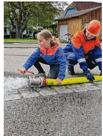
Schlauchwerfen und dann »Wasser marsch« - Die Mädchen und Jungen der Jugendfeuerwehrtabteilungen zeigten - ihren vielleicht künftigen KameradInnen - die wichtigen Handgriffe.