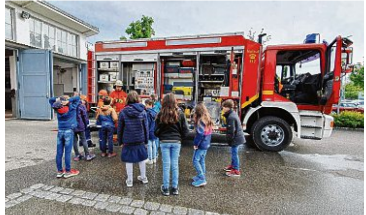
Was ist eigentlich alles in einem Feuerwehrauto? Das erfuhren die SchülerInnen bei der Führung.

Möglichkeit, Feuerlöschgeräte zu bedienen und die beeindruckende Ausrüstung der Feuerwehr hautnah zu erleben. Durch die Mitwirkung der engagierten Jugendfeuerwehr, die an diesem Tag deswegen vom Unterricht freigestellt wurde, erhielten sie Einblicke in die Aufgaben und den Alltag der Feuerwehr. Es war ein Tag voller Action und Lernen, der den Kindern eine unvergessliche Erfahrung bescherte und möglicherweise ihre Begeisterung für die Feuerwehr weckte.