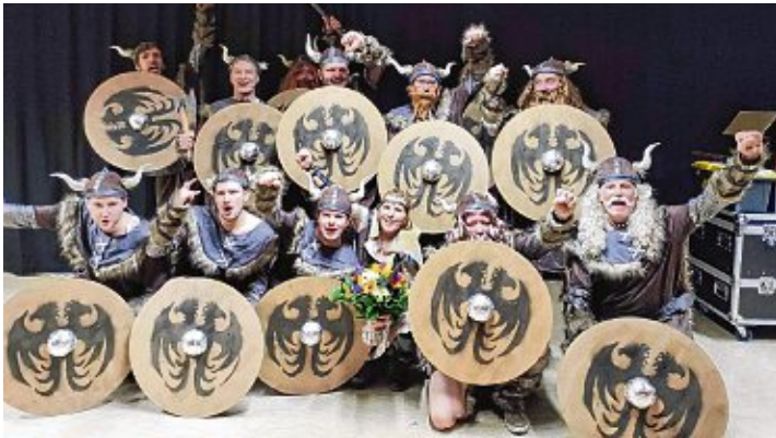
»Die Männer des Nordens« eroberten Neuhausen.

Bevor es in die Pause gehen konnte, wurde das Bürgerhaus von einem Haufen angsteinflößenden Piratinen gekapert und in Angst und Schrecken versetzt. Hierbei sorgte die Mädels – Tanzgruppe mit ihrem grandiosen Tanz » Auf hoher See « für eine überragende Stimmung.