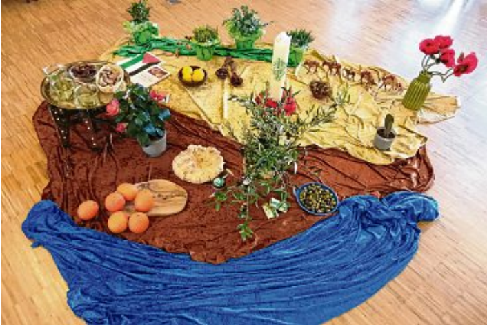
Alle Christinnen und Christen sind eingeladen, am Weltgebetstag gemeinsam ein Hoffnungszeichen gegen Hass und Gewalt zu setzen.

Dieses Jahr aus Palästina, der Wiege des Christentums.