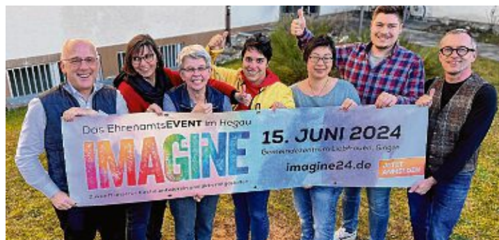
Jetzt anmelden zum Ehrenamts-Event am 15. Juni!