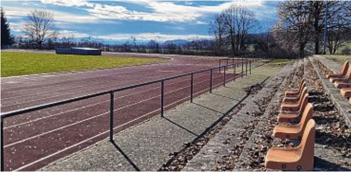
Noch liegt das Stadion im »Winterschlaf«, die Sanierung wird aber bald in Angriff genommen.