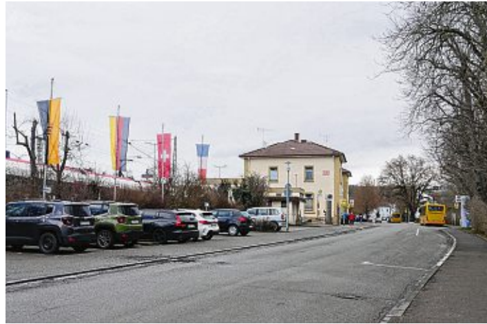
Hier könnte nach den Plänen der Stadt ein neuer Busbahnhof mit Schrägparkplätzen für die Busse entstehen.

Das Bahnhofareal soll sich grundlegend verändern. Doch die Flächen nördlich des Bahnhofgebäudes gehören der Bahn und diese benötigt sie noch zum Bau der geplanten Steganlage, welche erst ab 2026 entstehen soll. Stadtbaumeister Matthias Distler stellte im Ausschuss für Technik und Umwelt nun Entwürfe zur Gestaltung eines Busbahnhofs unabhängig von diesem Areal vor.