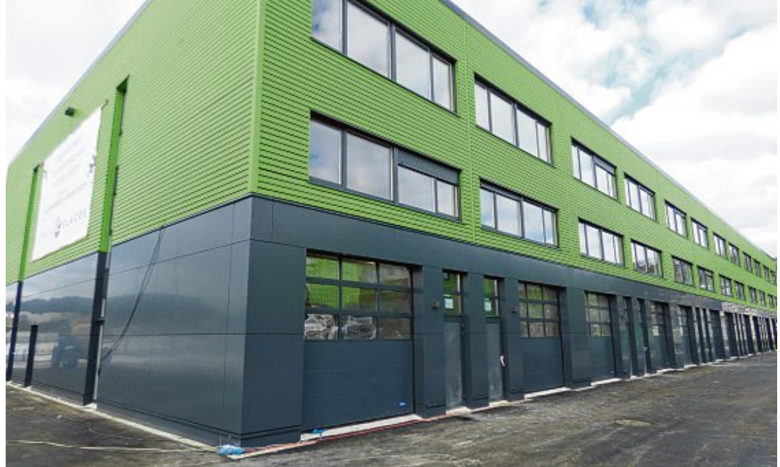
Mit ihrer markanten Farbgebung wirken die GreenPlaces-Hallen modern und einladend.

Für die Gemeinde Gottmadingen sei es wichtig gewesen, dass auf einer der letzten freien Flächen keine großen Speditionen Lager- und Umschlaghallen gebaut würden. Das Konzept und die verdichtete Bauweise von GreenPlaces haben überzeugt. Die Hallen mit drei Stockwerken sind mit Solaranlagen und Glas-