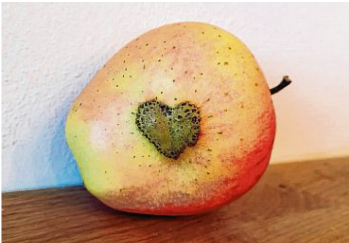
Dieses Herz Unikat wurde von einer Raupe in den Apfel geknabbert.

Der QR-Code zeigt ein Video des Lernorts Bauernhofs über den Magdalenenhof. Oder man gibt ganz einfach auf Youtube das Wort »Obstvielfalt« in das Suchfeld ein