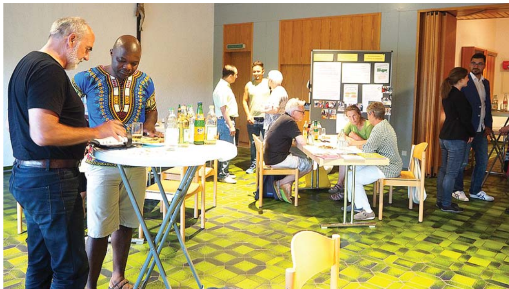
Bei der Gesamthelferkonferenz informierte der Helferkreis Engen an verschiedenen Stationen über seine Arbeit.