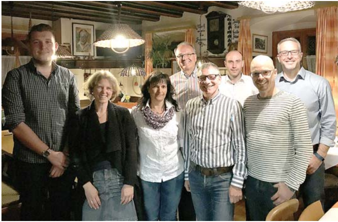
Im Anschluss an die Jahreshauptversammlung stellte sich die zum Teil neu- beziehungsweise wiedergewählte Vorstandschaft des Skiclubs Engen zum Foto.