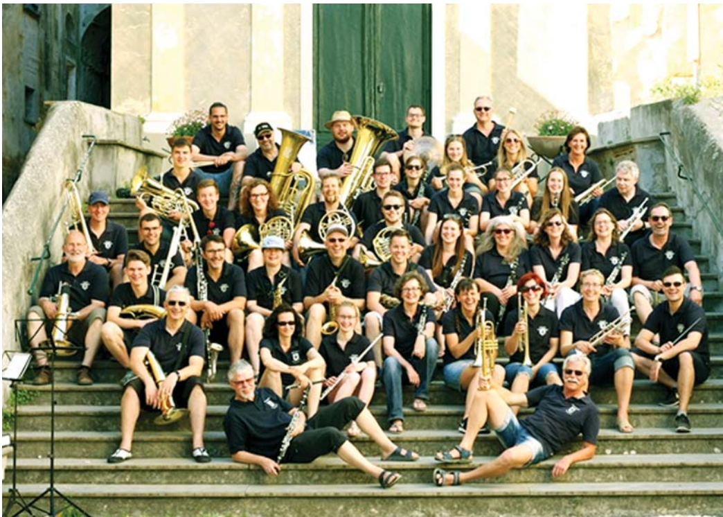
Abwechslungs- und begegnungsreiche Tage erlebten die Musikerinnen und Musiker der Stadtkapelle Engen in der italienischen Partnerstadt Moneglia.