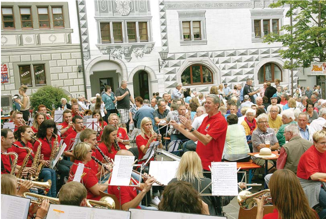
Heute, Mittwoch, 14. Juni, beginnen die beliebten Feierabendkonzerte auf dem idyllischen Marktplatz in Engen. Zum Auftakt spielt der Musikverein Welschingen.