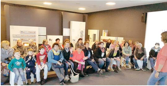
Der Ferienhof Brunner und das Ritter-Sport-Werk auf der Schwäbischen Alb standen auf dem Ausflugsprogramm der Landfrauen Stockach-Engen.