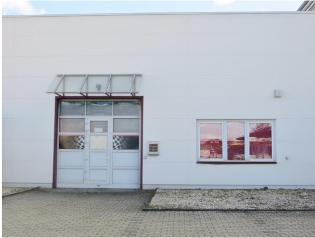
Zufahrt mit Rolltor