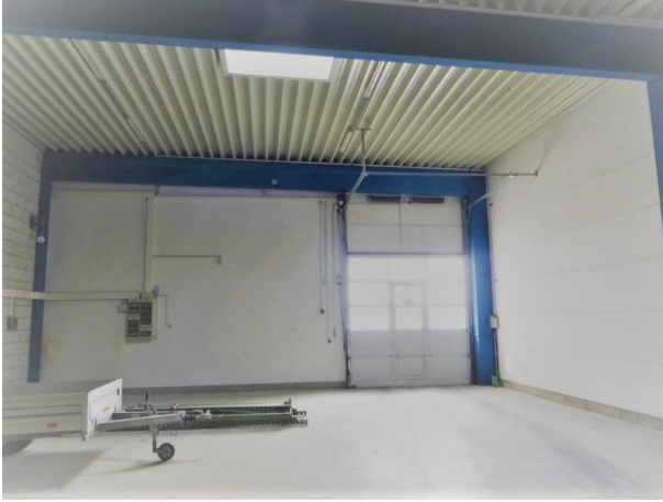
Blick zum Rolltor